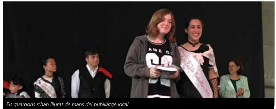
Els guardons s'han lliurat de mans del pubillatge local.