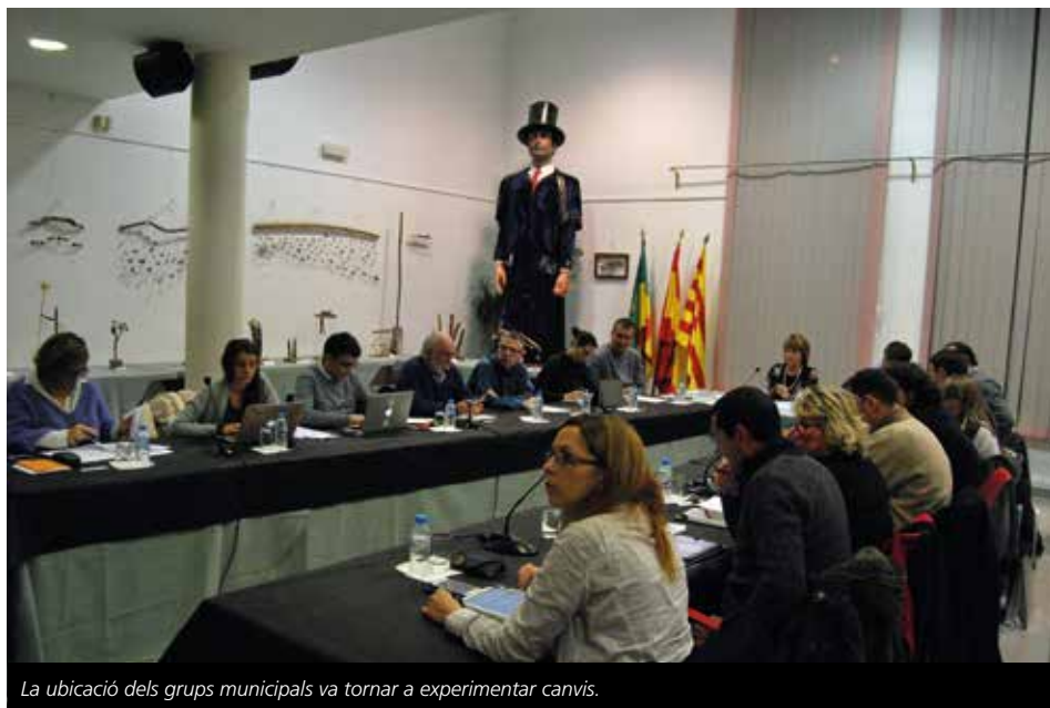
La ubicació dels grups municipals va tornar a experimentar canvis.