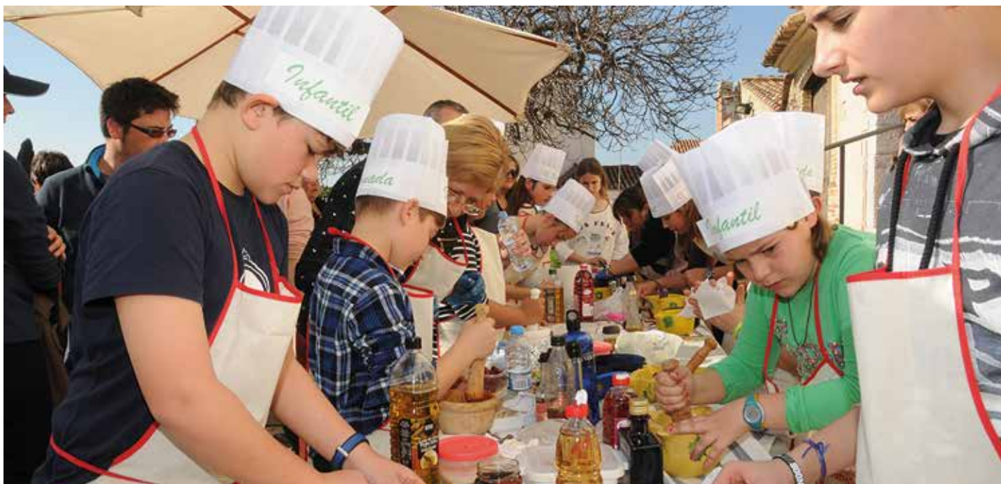
La xatonada popular tindrà lloc el 25 de febrer.

En ple mes del xató tindrà lloc la Xatonada popular de Cubelles, programada pel 25 de febrer i que arriba a la 17a edició. La jornada acollirà els tradicionals concursos de mestres xatonaires adult i infantil. Aquest any, com a novetat, es proposa omplir tot el cap de setmana de diferents activitats per promocionar la vila i incentivar les pernoctacions a Cubelles i atraure els visitants de segones residències per venir tot el cap de setmana.