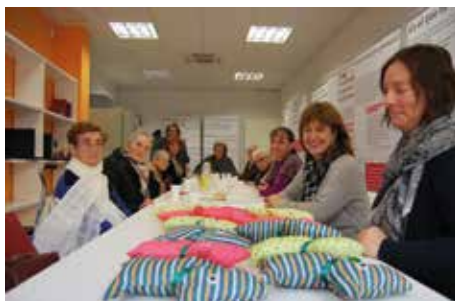
L'organisme treballa per les dones de totes les edats.

Des que es va crear l'organisme, algunes de les associacions que es van involucrar en el seu funcionament han patit canvis, d'altres han desaparegut i, a més, al llarg d'aquests gairebé quatre anys, n'han nascut de noves. Per tot plegat, des del mateix consell s'ha