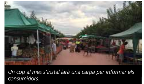
Un cop al mes s'instal·larà una carpa per informar els consumidors.

gratificació d'aquesta acció s'allargarà fins el 16 d'abril a les dependències de l'OMIC fent entrega d'uns vals descompte per adquirir bombetes de baix consum a les ferreteries del poble fins a exhaurir existències.