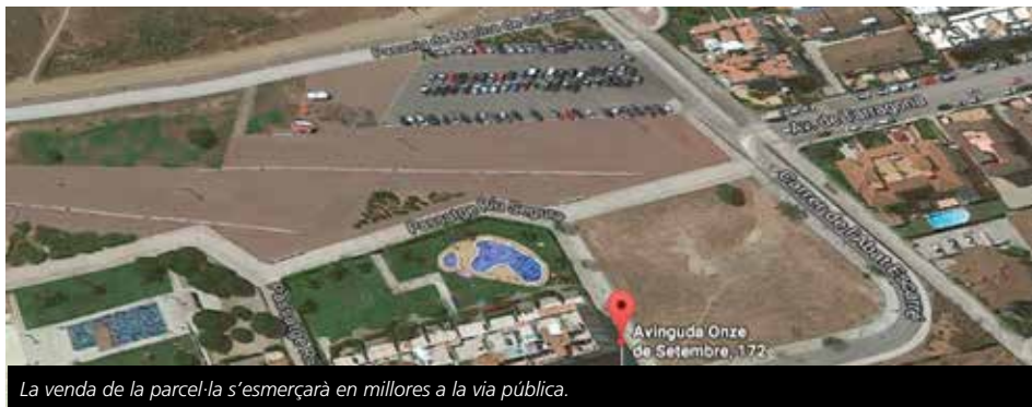
La venda de la parcel·la s'esmerçarà en millores a la via pública.

L'ingrés extraordinari permetrà finançar diverses inversions previstes al pressupost 2018