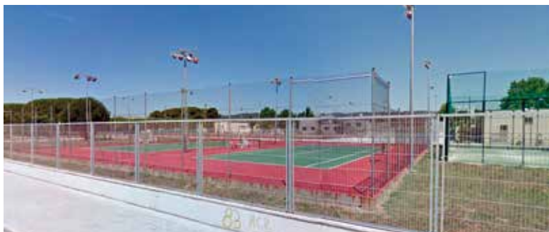
Les pistes de tennis es beneficiaran de la decisió popular.

La voluntat del Consistori ha estat encabir el màxim nombre de propostes per esgotar els 150.000 euros, de manera que s'han anat incorporant projectes mentre ha quedat pressupost, passant a la següent per ordre de votació, el que ha permès arribar al finançament de nou propostes ciutadanes.