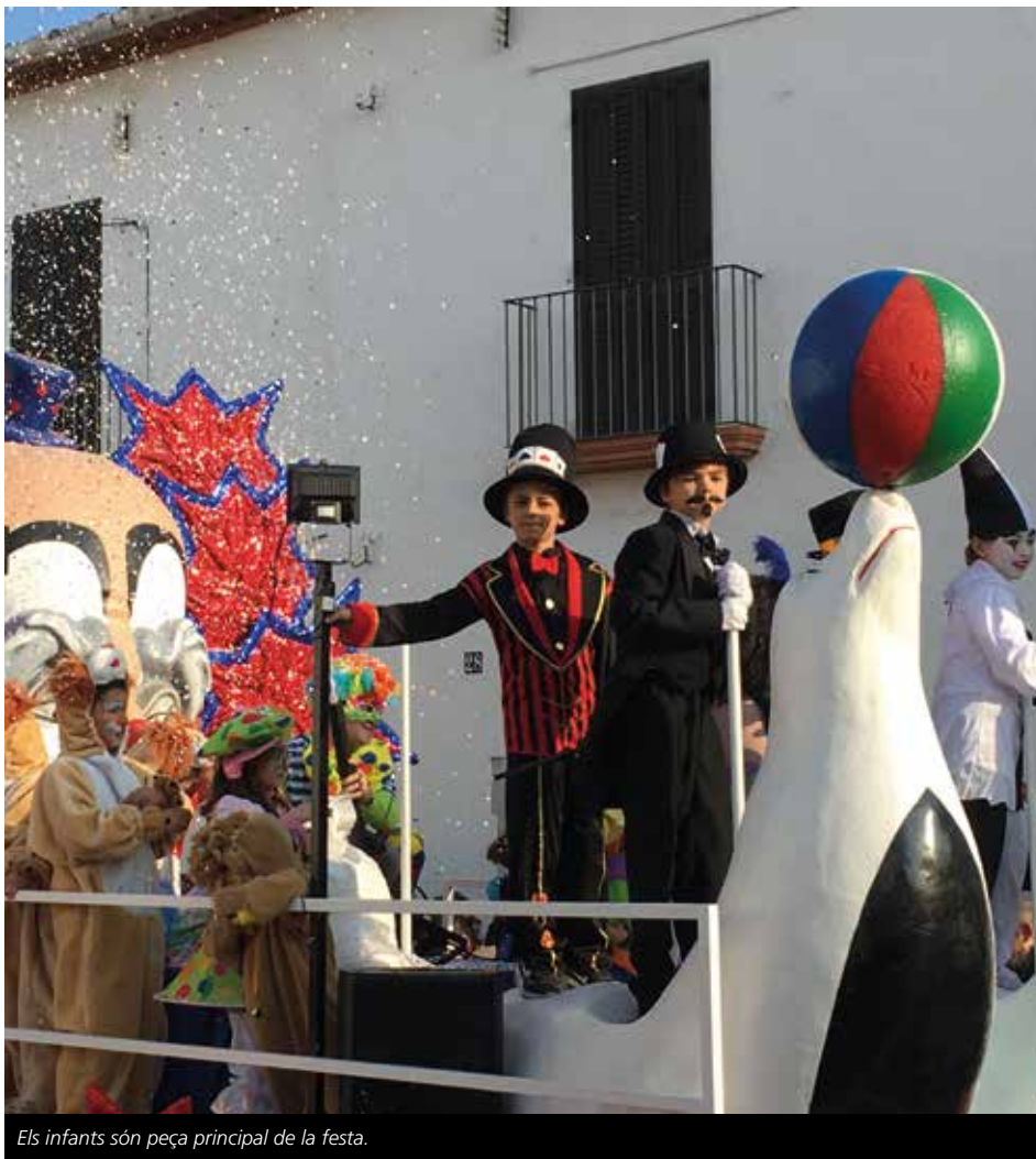
Els infants són peça principal de la festa.

La Rua de dissabte tornarà a ser l'acte amb més afluència de públic