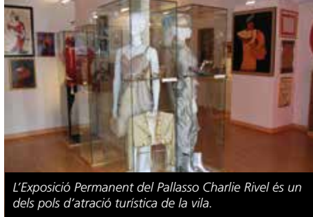
L'Exposició Permanent del Pallaso Charlie Rivel és un dels pols d'atracció turística de la vila.

El canal principal d'atenció és el presencial amb un 84,19%, mentre que les consultes telefòniques representen el 14,69% i a través del correu electrònic l' 1,12% i majoritàriament es tracta de peticions d'informació