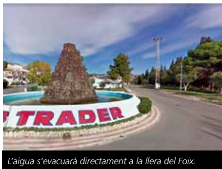
L'aigua s'evacuarà directament a la llera del Foix.

En el cas del carrer Assutzena s'han instal·lat dues reixes travesseres al tram sud del vial, entre la rotonda amb el carrer Gessamí i la font de Mas Trader, a través de les quals s'evacuarà l'aigua de pluja que es canalitza dels carrers superiors i s'abocarà directament a la llera del