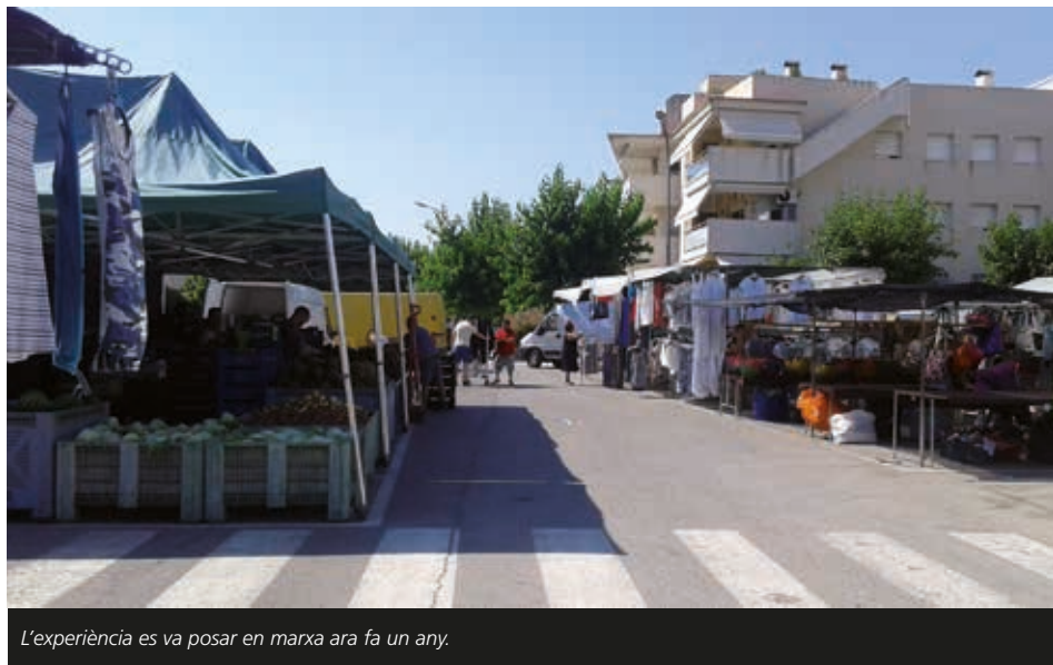
L'experiència es va posar en marxa ara fa un any.

Com l'any passat, l'Ajuntament de Cubelles facilitarà un aparcament gratuït a