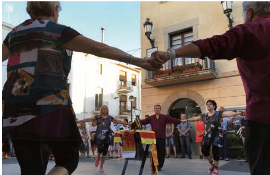
Autoritats i veïns donen la benvinguda al fanalet.

L'Ateneu Sobiranista Català convoca als qui vulguin anar a recollir la flama procedent del Canigó a Vilanova i la Geltrú. Els voluntaris sortiran a les 18.00 h. de la plaça de la Vila per anar a cercar la flama de mans de diversos veïns del municipi, els Amics del Castell i de l'associació de veïns del barri de Sant Joan de la capital del Garraf, qui al seu torn hauran portat la flama directament de la muntanya del Canigó.