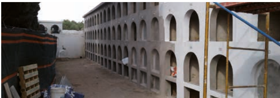
La rehabilitació dels nínxols ha ascendit a 34.000 euros.

Per altra banda, s'acaba d'adjudicar per un cost aproximat de 21.000 euros la construcció d'una nova ossera en superfície, per evitar els problemes de filtracions, i 25 columbaris nous. Aquestes construccions es completaran amb una petita urbanització de l'espai i la d'uns serveis públics, que actualment no existeixen. A nivell administratiu, aquestes tasques conviuen amb la redacció d'un nou Reglament del cementiri i dels serveis funeraris pertinents que actualitzi l'actual, que és de l'any 1998, i en breu sortirà a licitació el contracte de gestió i manteniment del cementiri municipal.