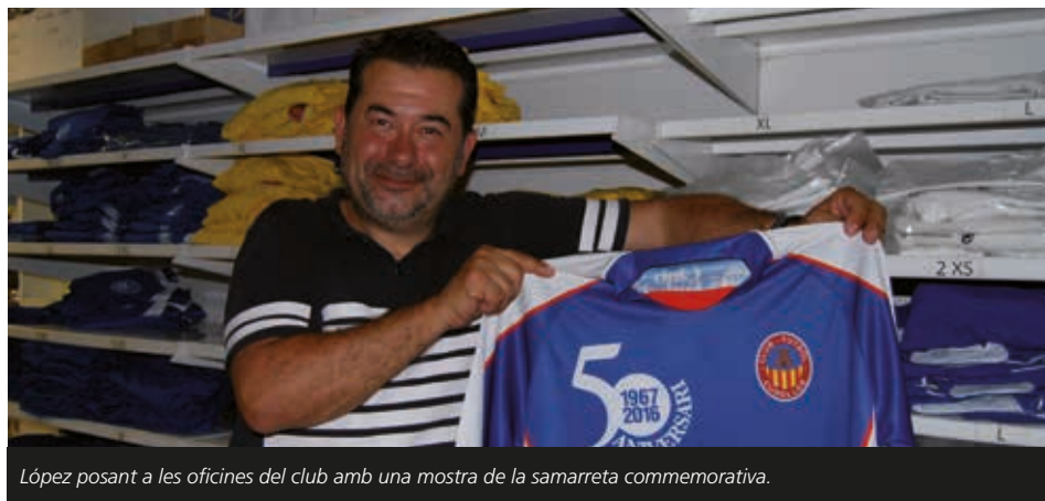
López posant a les oficines del club amb una mostra de la samarreta commemorativa.

Intentarem motivar la gent perquè el camp s’ompli més. Avançarem l’horari i jugarem una hora abans, a les 17.00 h., i organitzarem activitats i concursos a les mitges parts per atraure més públic, sobretot canalla que arrossegui de retruc als pares.