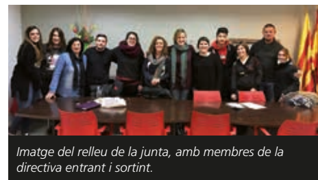
Imatge del relleu de la junta, amb membres de la directiva entrant i sortint.

tiva i evitant les diferències d'edat entre els membres. La nova junta, formada per persones que provenen de diverses colles, busca noves fórmules per incrementar els ingressos amb la implicació de les colles en l'organització de festes, gestió de barres i venda de marxandatge. Tot amb l'objectiu de seguir millorant els elements del bestia-