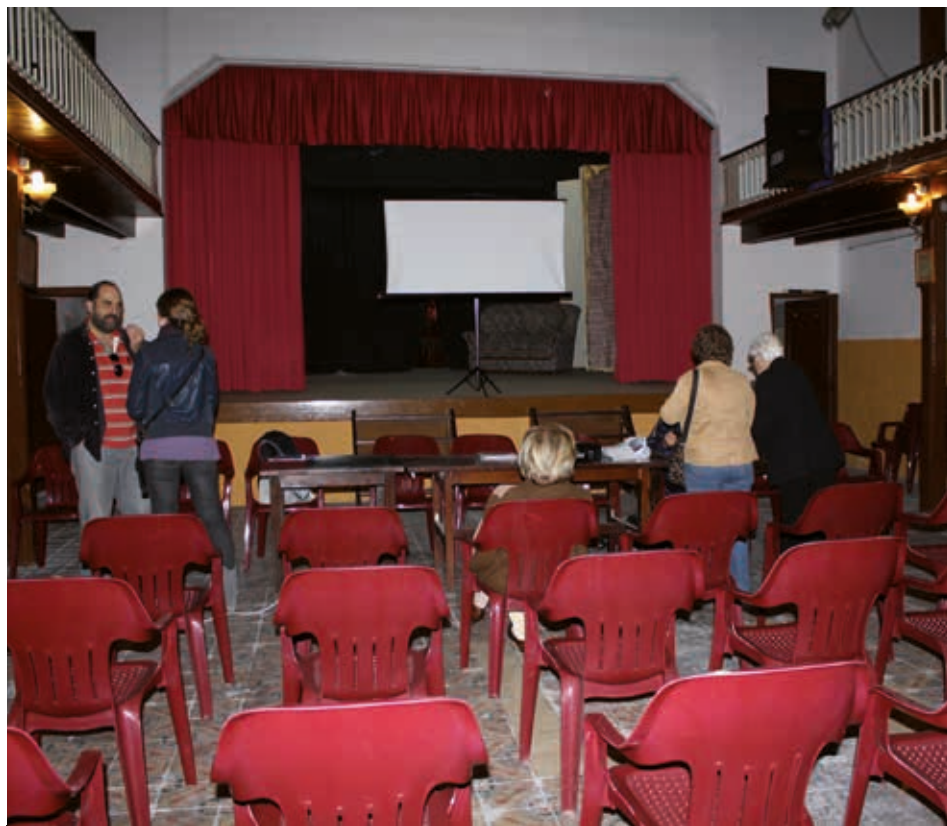
Imatge d'una assemblea de l'entitat la primavera del 2010.

sobre la reobertura de l'històric edifici, l'entitat ha organitzat un acte públic amb la presència del conseller de Cultura, Santi Vila. Serà el dimarts 4 de juliol a la sala d'exposicions del Centre Social a les 20.45 h. i la trobada tindrà també la presència del vicepresident de la Diputació de Barcelona i alcalde d'Igualada, Marc Castells.