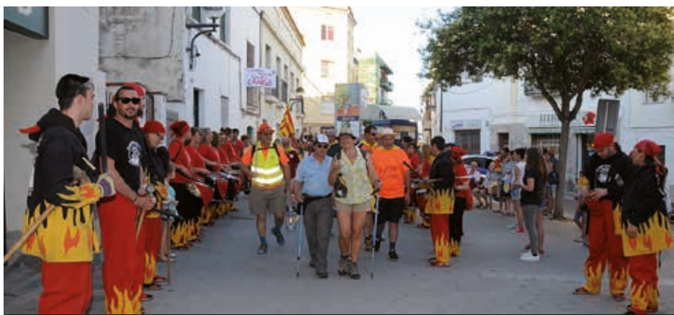
La flama és traslladada directament del Canigó a Cubelles.