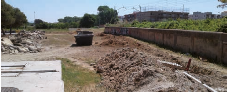
Les obres de la nova zona d'esbarjo per a gossos ja s'han iniciat.

La construcció de l'espai d'esbarjo per a gossos al carrer Millera, tocant al pont del carrer d'Arles de Tec, està en marxa. El Servei Municipal d'Obres (SMO) coordina les tasques de diverses empreses que han d'executar els moviments de terres i la construcció de voreres, mentre que el muntatge del tancat exterior, reparació del mur de separació amb les vies del ferrocarril i la construcció i muntatge dels elements d'esbarjo aniran a càrrec de personal propi.