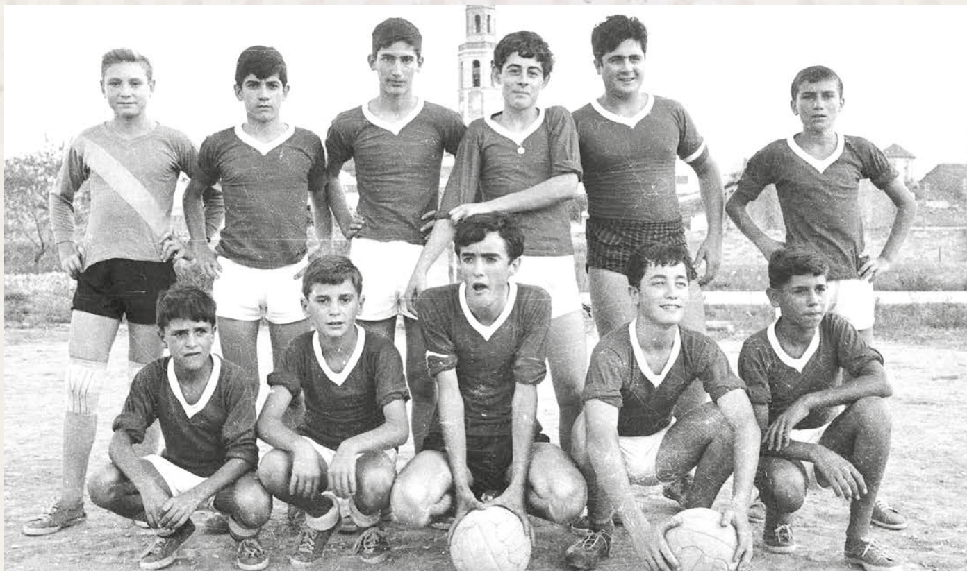
Racó d'en Pineda: Partit de futbol a l'Hort del Rector, anys 60.

L'afició del futbol a Cubelles ha estat ben arrelada des de començaments del segle XX. A la dècada dels 60 van ser força freqüents els partits entre joves de la vila i estieujants al camp de l'Hort del Rector. Aquest va ser, de fet, l'origen del CF Cubelles.