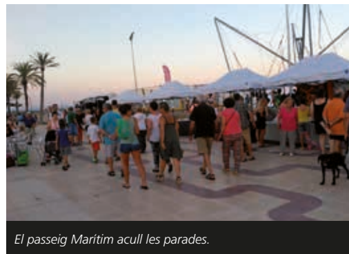
El passeig Marítim acull les parades.

risme, Comerç i Fires els distribuïran entre el passeig de la Mar Mediterrània i el passeig de la Marina. Durant el mes de juliol, la fira serà els divendres, dissabtes i diumenges i durant el mes d'agost, l'ocupació passarà a ser diària.