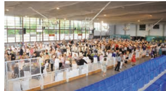
L'Ajuntament vol redactar un pla d'acció per als veïns de més edat.

vés de l'OPIC, el Casal d'Avis o enviant un correu electrònic a socials@cubelles.cat .