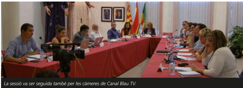
La sessió va ser seguida també per les càmeres de Canal Blau TV.

S'aprova iniciar els tràmits perquè els veïns també puguin fer preguntes a títol individual