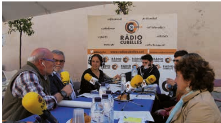
L'emissora municipal ha celebrat enguany el seu 36è aniversari.

Tota la programació estarà com sempre disponible al web www.radiocubelles.cat i a l'app mòbil de Ràdio Cubelles.