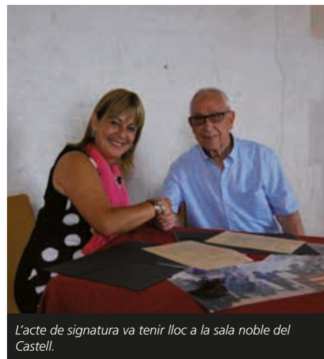
L'acte de signatura va tenir lloc a la sala noble del Castell.

L'Alcaldessa va cloure l'acte anunciant que l'Ajuntament està treballant perquè pròxi-