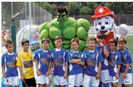
El prebenjamí del CF Cubelles ha completat una temporada excel·lent.

El CF Cubelles, de la seva banda, ha finalitzat en sisena posició una temporada molt