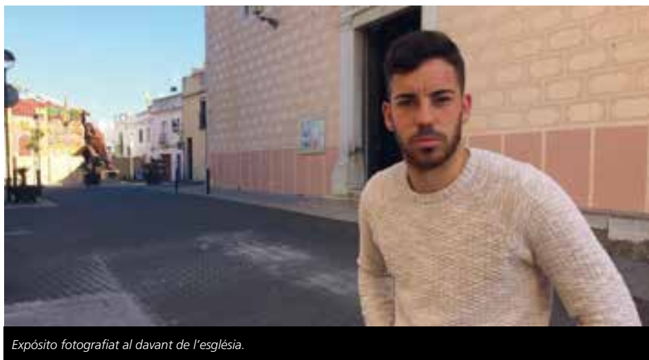
Expósito fotografiat al davant de l'església.

Sent molt oportú. Un company tenia molèsties i l'entrenador va decidir canviar-lo en el