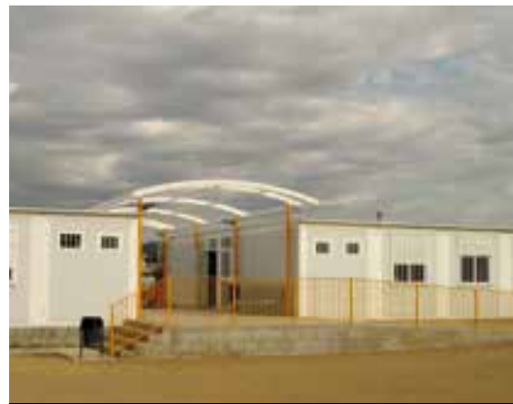
L'INS Les Vinyes és en barracons des de fa una dècada.

la nova llei del territori, amb entrada en vigor prevista l'any 2018, el canvi més significatiu de la qual és que la competència en el planejament urbanístic passarà a ser exclusivament municipal, de manera que la Generalitat intervindrà únicament en l'aprovació d'un document previ al POUM, similar a l'avanç de projecte. El subdirector general d'Urbanisme ha assenyalat la importància de la memòria social, el document que acompanya la redacció inicial del projecte i que ha de justificar el creixement futur del municipi. Aquest incís podria implicar replantejar les diverses propostes de creixement previstes en l'avanç que finalment no es va aprovar.