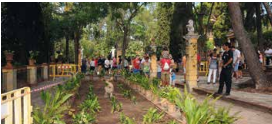
Les jornades de portes obertes a la finca han tingut una gran acceptació.

En total, els projectes comuns del Garraf sumen 332.051,40€, dels quals un 50% els assumirien els fons europeus.