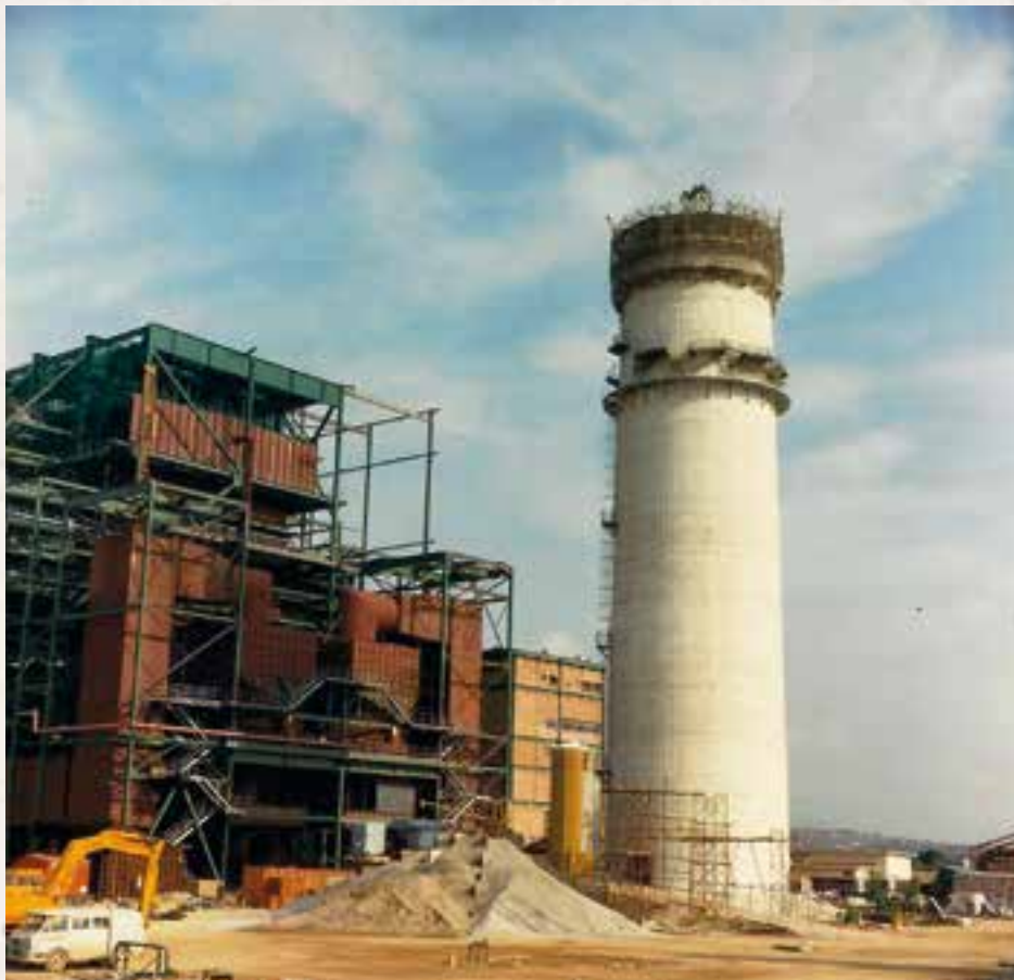
Racó d'en Pineda: Construcció de la Tèrmica, el 1977.

La instal·lació de la central Tèrmica de Cubelles va originar un fort enfrontament social i polític a la vila. La construcció de l'equipament va iniciar-se l'octubre de 1976 malgrat l'oposició d'una part molt significativa de la població. La xemeneia, el seu element arquitectònic més simbòlic, va anar prenent forma tot just l'any següent. (57)