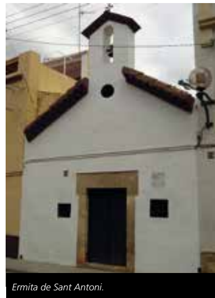
Ermite de Sant Antoni.