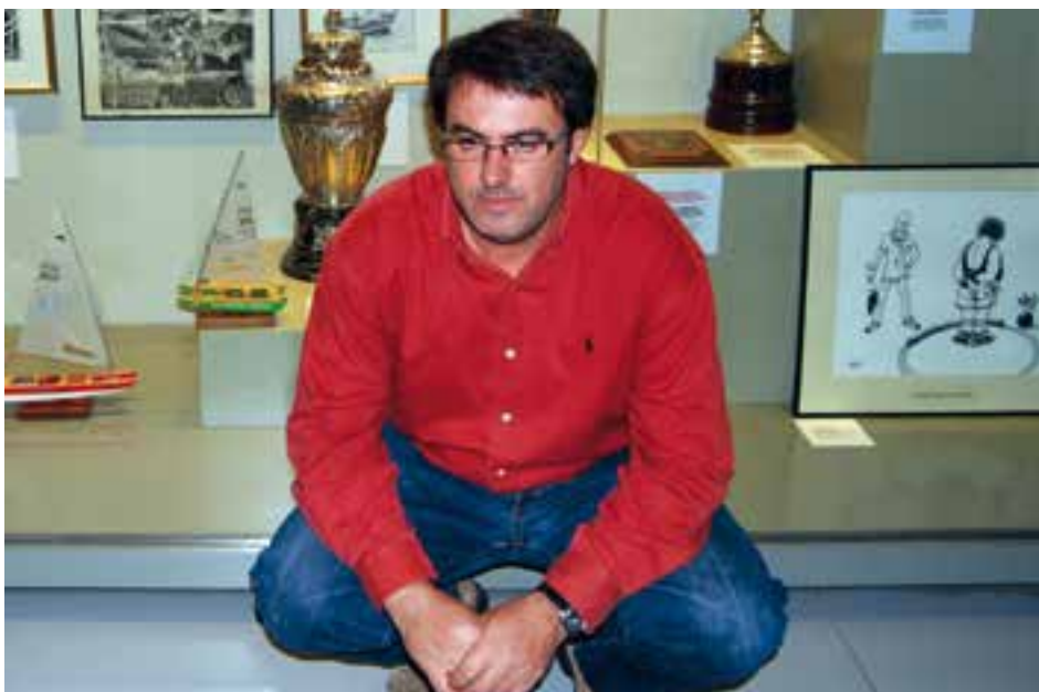
El fins ara president ha ocupat el càrrec dues dècades.