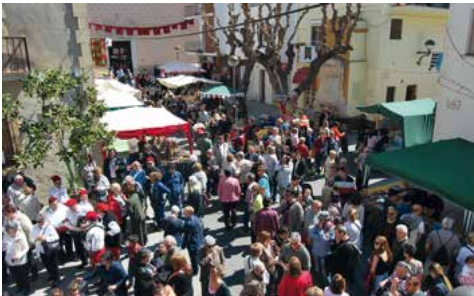
La trobada és de les més multitudinàries que s'organitzen a Cubelles.

A la plaça del Centre Social es concentraran els establiments de restauració, que comptaran amb una zona de pícnic i una gran carpa on s'oferirà braseria i poperia.