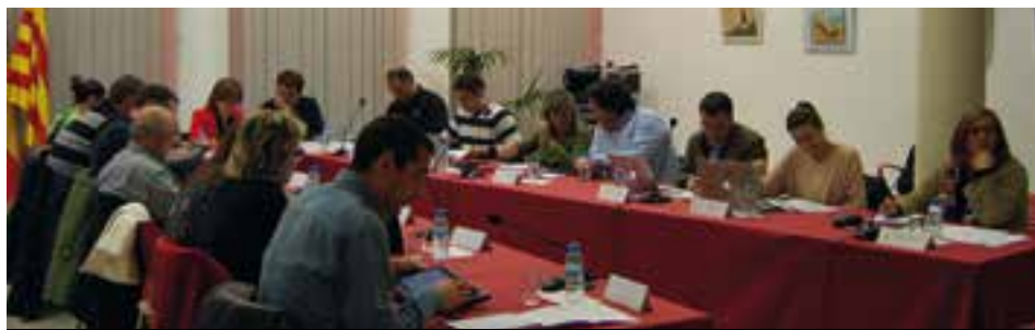
El municipi opta a rebre una subvenció de la Generalitat que ajudi a finançar el projecte.

Finalment, la sessió ordinària ha aprovat la segona fase de la substitució de la canonada d'aigua potable de fibrociment de la zona de Mas Baró per un cost de 31.114,48 euros i la massa salarial laboral de l'Ajuntament per a l'exercici 2017, que ascendeix a 1.493.626,17 euros.