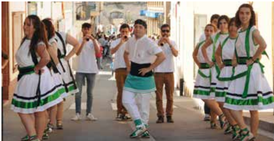
Els Balls Populars donen el tret de sortida a la seva temporada d'activitats.

Finalment, el dijous 27 d'abril (19.00 h. Sala d'actes de la Parròquia) es debatrà sobre la recentment aprovada Vegueria del Penedès, en una conferència a càrrec Ramon