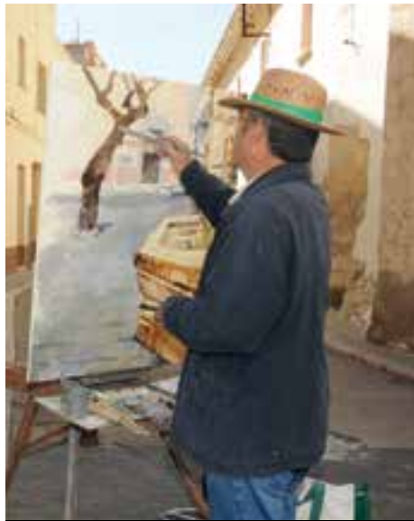
Un any més, la cultura s'apoderarà dels carrers de la vila.

L'altra gran novetat seran les visites guiades a la sala noble del Castell (27 i 29 d'abril, 17.00 h.), una vegada la Diputació de Barcelona ha lliurat unes guies didàctiques que completen la reforma de la segona planta de l'edifici històric. L'accés a l'activitat serà limitada i en grups reduïts amb inscripció prèvia a través del correu charlierivel@cubelles.cat i del telèfon 93 895 25 00.