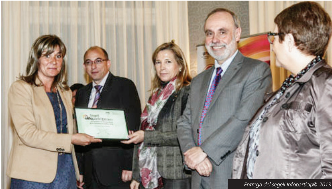
Entrega del segell Infoparticip@ 2013

El grau de compliment de transparència i qualitat comunicativa puja al 95,12%