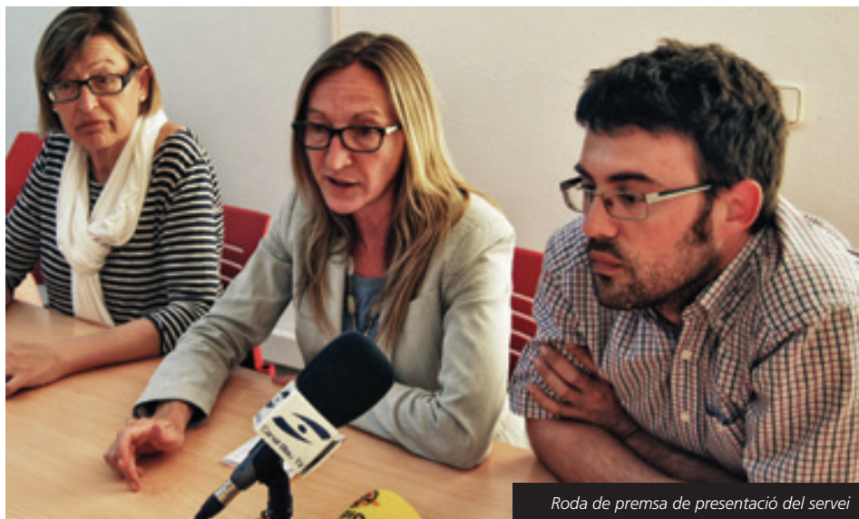
Roda de premsa de presentació del servei

(08:45, 11:00, 13:00, 15:00, 17:00, 19:00 i 21:00)