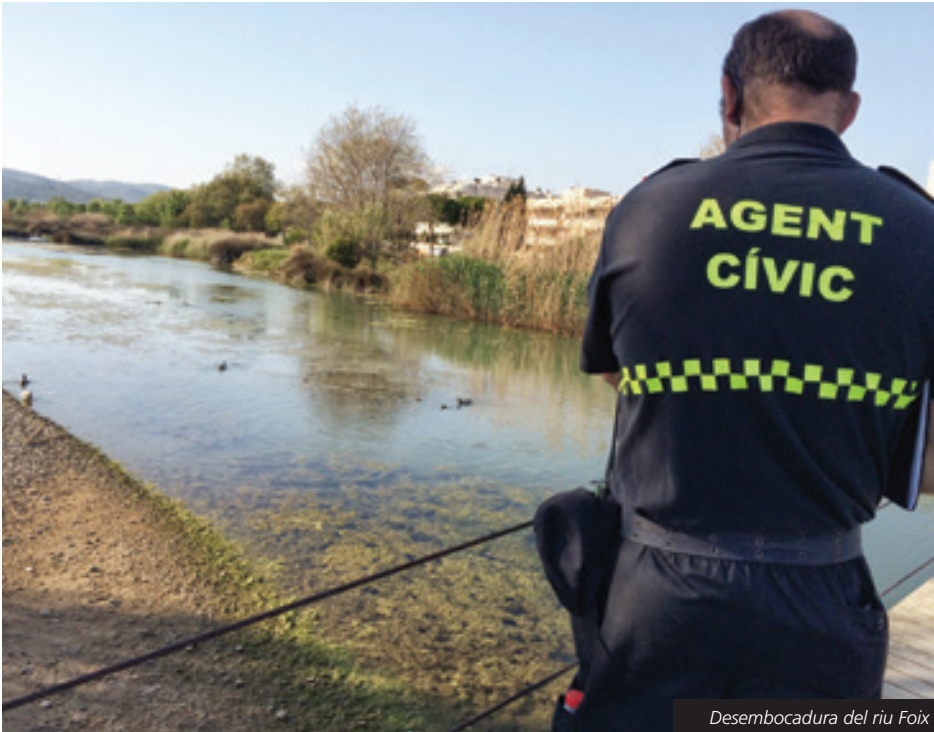
Desembocadura del riu Foix

Fins a finals d'any es manté per sensibilitzar als visitants del respecte de la fauna i la flora