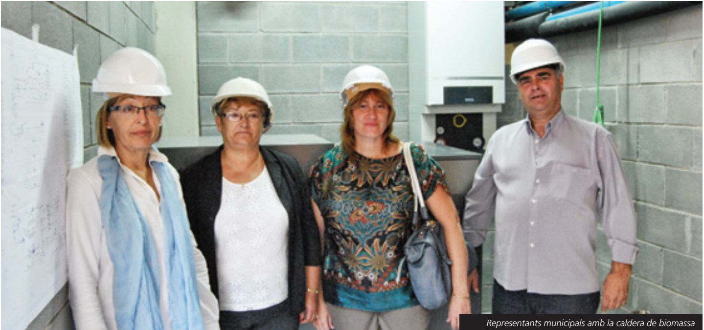
Representants municipals amb la caldera de biomassa

Al nou equipament esportiu s'hi han instal·lat calderes de biomassa i plaques solars