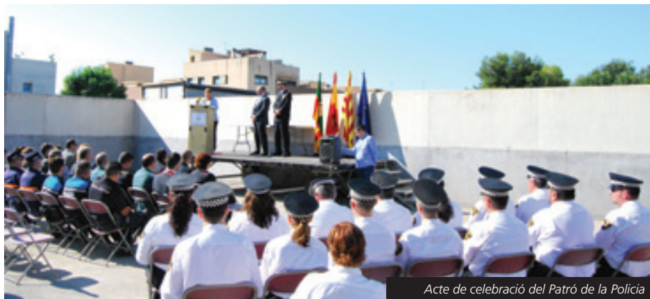
Acte de celebració del Patró de la Policia

L'acte de celebració del Patró del cos torna a acollir el reconeixement públic per la bona tasca i professionalitat