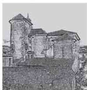
Amics del Castell