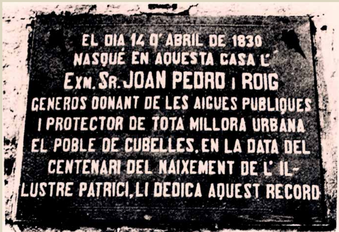
Placa commemorativa a la casa on va néixer l'indiàno.