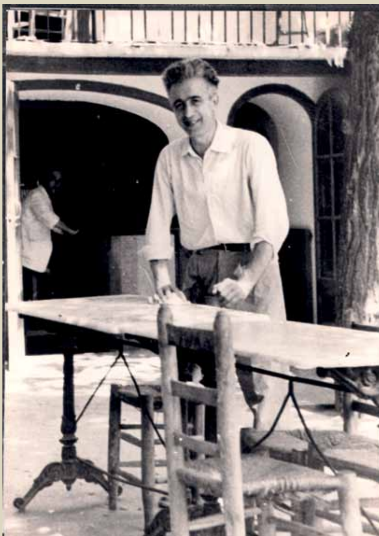
L'Antonet, al jardí del seu cafè, als anys cinquanta

una placa amb una poesia seva al costat de la font del carrer Major.