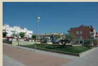
La plaça de David Albet, en l'actualitat