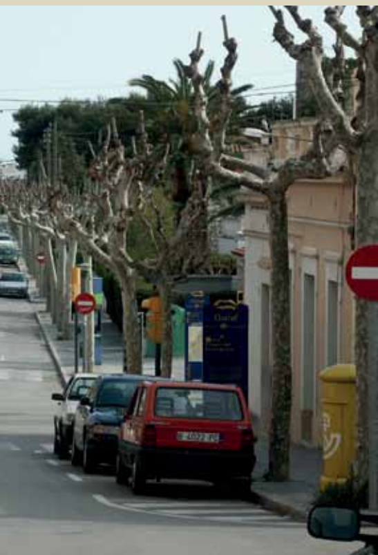
El passeig de Narcís Bardají, als anys vuitanta

Carreró sense sortida que surt de la part inicial del carrer del Mig en direcció a migjorn.