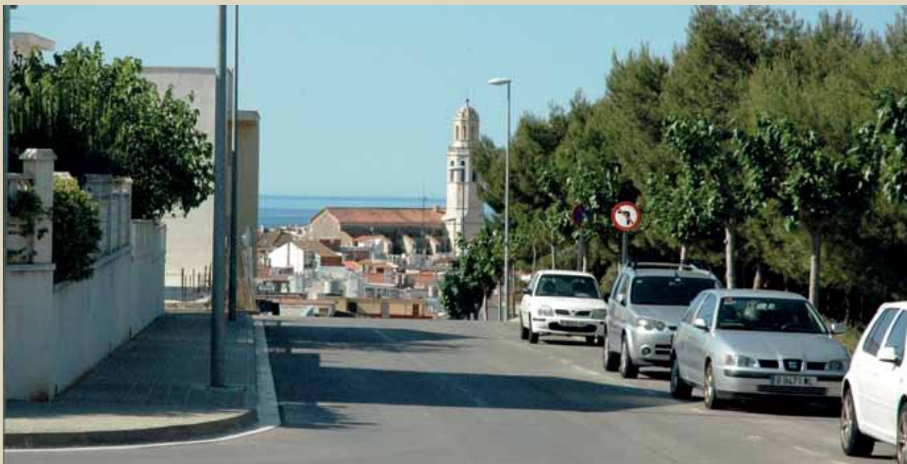
El carrer de Sebastià Puig, actualment.

que, ja en edat molt avançada, es traslladà a Vilanova i la Geltrú. L'any 1982 fou objecte d'un homenatge, celebrat al Poliesportiu de Cubelles, per part dels antics membres del Centre Catequístic.