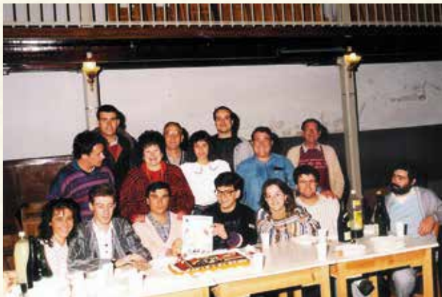
Els col·laboradors d'El Full de Cubelles celebrant la publicació del número 25 d'aquesta revista municipal l'abril de 1989. (Antoni Pineda).