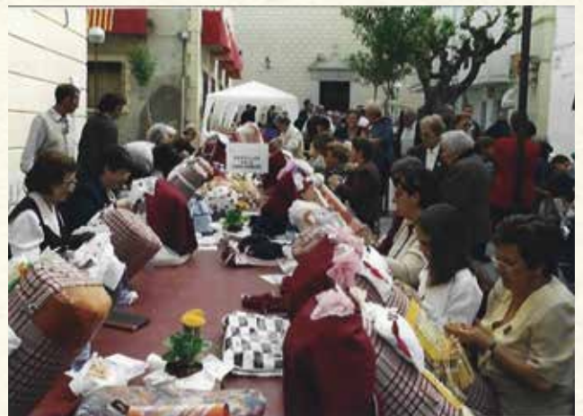
Les Puntaires de Cubelles al carrer Major (1999). (Antoni Pineda).

Ja hem vist, doncs, com algunes commemoracions destacades del poble s'han fet coincidir amb la Setmana Cultural. I aquest és també el cas del centenari del Cor l'Espiga, molts actes del qual es van incloure en l'edi-