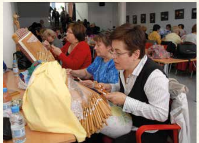
La trobada de puntaires, al Centre Social Joan Roig i Piera, en 2009.