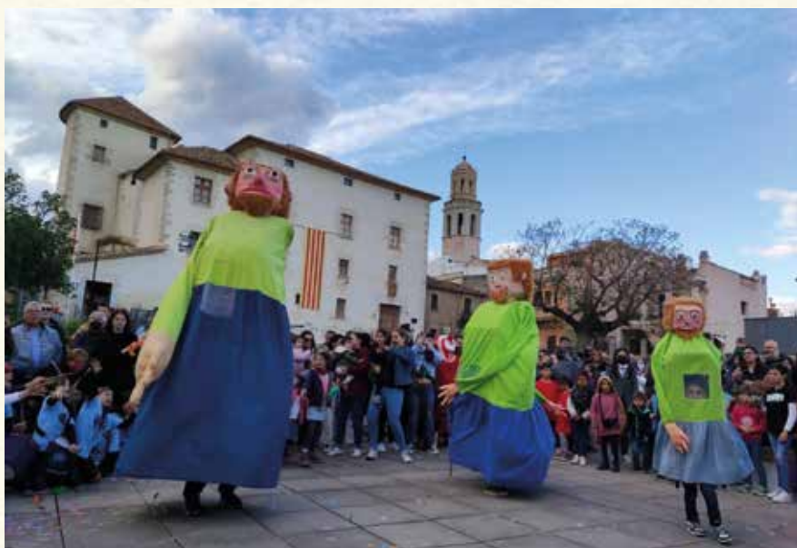
Trobada de gegants, cagrossos i bèsties infantils (2022). (Joan Vidal).

La Societat L'Aliança, en el seu intent de revitalització malgrat tenir el seu edifici tancat, es tornaria a involucrar en l'organització de la Setmana Cultural amb una lectura, el dia de Sant Jordi de 2012, de fragments