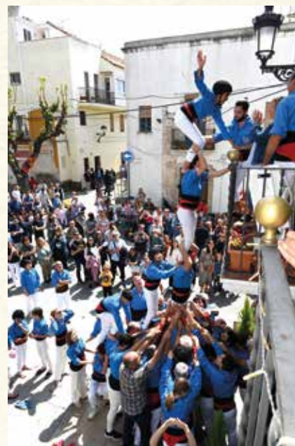
Exhibició dels Castellers del Foix, el 2023. (Montse Torrado).

En aquests darrers anys s'ha incorporat un nou actor al teixit associatiu local que s'ha involucrat amb força amb l'organització de la Setmana Cultural. Es tracta del col·lectiu d'artis-