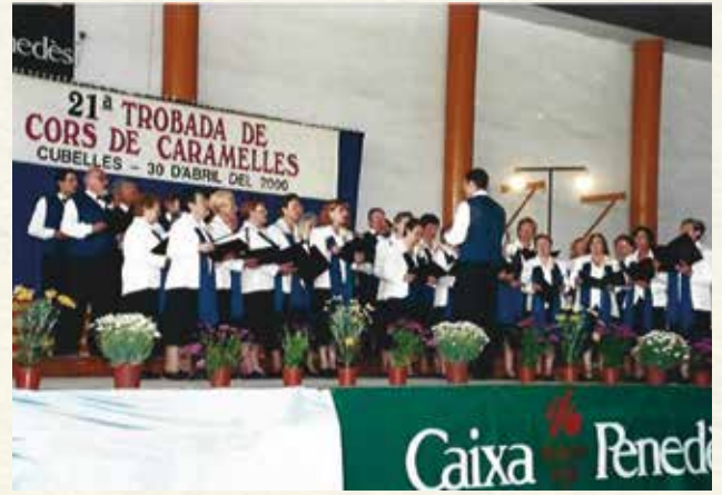
Actuació del Cor l'Espiga en la Trobada de Cors de Caramelles durant el centenari de l'entitat (2000). (Antoni Pineda).