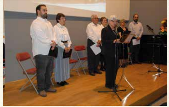
El Grup de Teatre del Casal de Cultura en una representació (2008). (Montse Torrado).