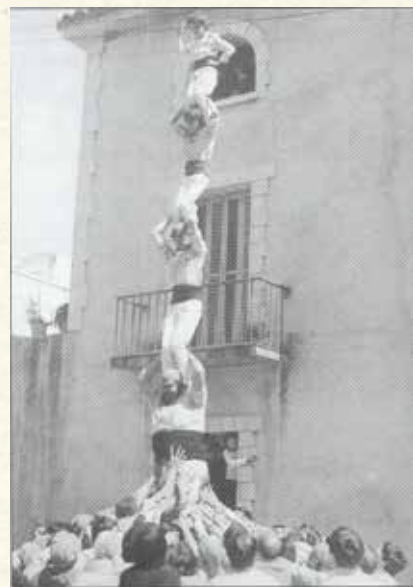
Actuació dels Bordegassos a la plaça de la Vila (1978).

El programa de 1977 s'inicià el dissabte 16 d'abril a la nit amb un recital apoteòsic a L'Aliança de Francesc Pi de la Serra, un dels històrics de la Nova Cançó. L'endemà, el grup de teatre del GER de Sant Pere de Ribes representà l'obra “Preguntes i respos-