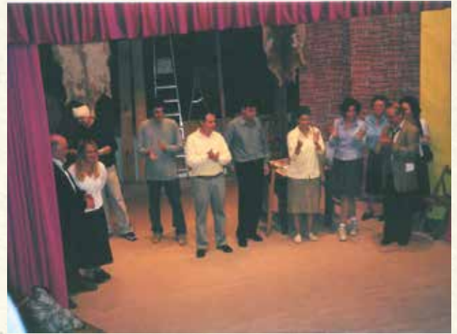
L'elenc de La Tramoia, de L'Aliança, després de representar Assaig General (2011)..