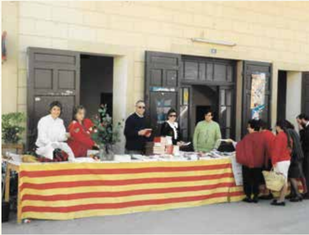
Parada de llibres i roses de l'Associació d'Hostaleria i Comerç (1989). (Arxiu Antoni Pineda).