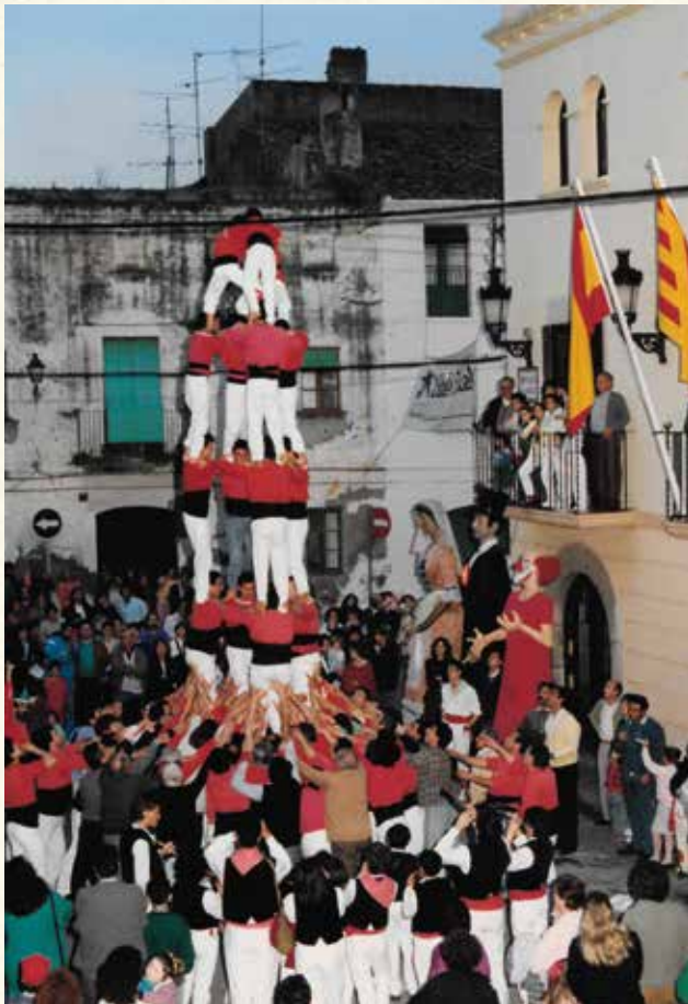
La Colla Jove dels Xiquets de Valls a la plaça de la Vila (1988). (Antoni Pineda).