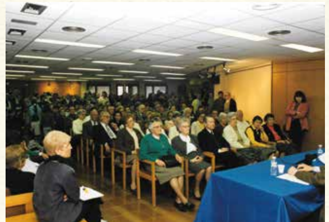
La sala del Casal d'Avis durant la presentació del llibre Història Gràfica de Cubelles (1995). (Antoni Pineda).