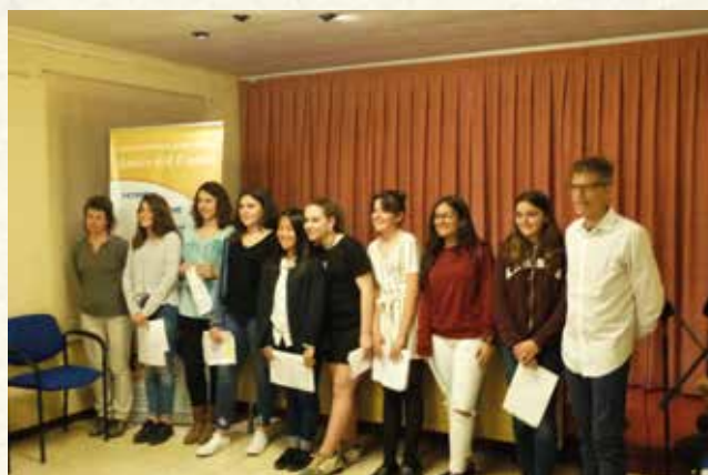
Alumnes de l'Institut Cubelles i professors seus en la commemoració del 150è aniversari de Pompeu Fabra. (2018). (Montse Torrado).