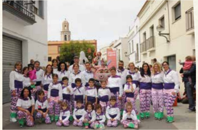
La colla de la Draga de l'ABPC (2017). (Montse Torrado).