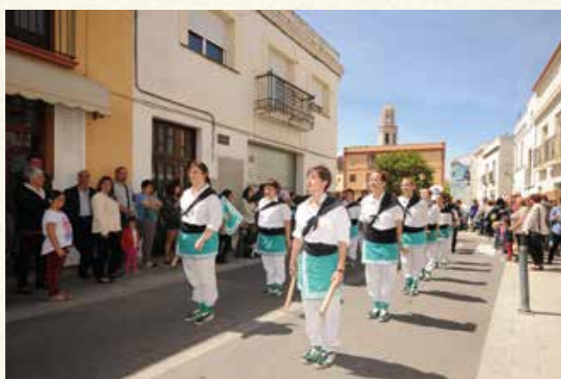
El Ball de Bastons de l'ABPC durant la cercavila de 2014. (Montse Torrado).