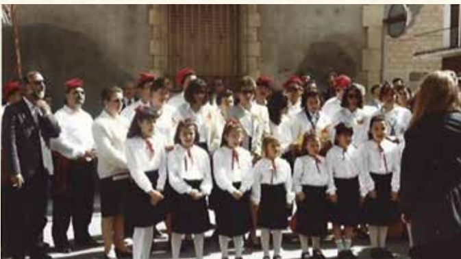
La Coral Els Estels i el Cor l'Espiga en les caramelles de 1992. (Antoni Pineda).