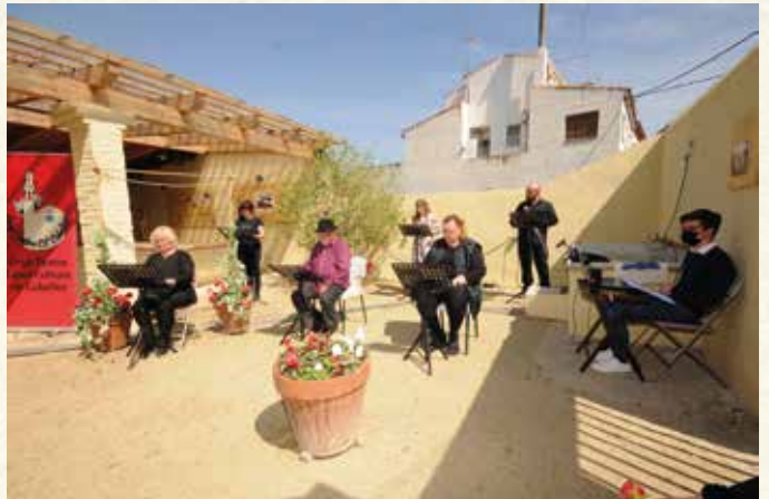
El Grup de Teatre del Casal de Cultura fent una representació als safareigs (2021). (Montse Torrado).