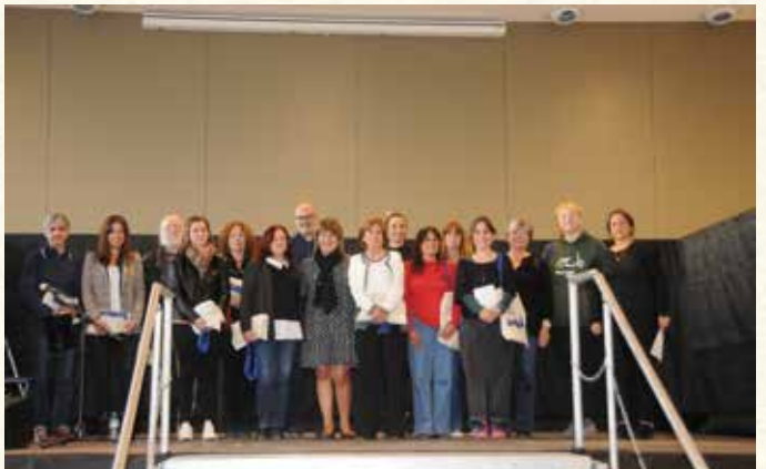
Imatge corresponent al lliurament dels premis del concurs Víctor Alari (2022). (Montse Torrado).