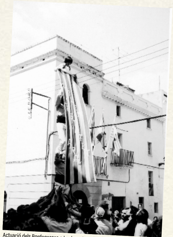
Actuació dels Bordegassos a la plaça de la Vila, el 1977, en plena campanya de Volem l'Estatut. (Isidre Rosell).