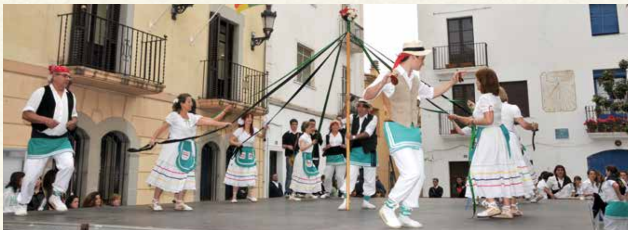
El Ball de Gitanes de l'Agrupació de Balls Populars de Cubelles (ABPC) en plena actuació (2012). (Montse Torrado).