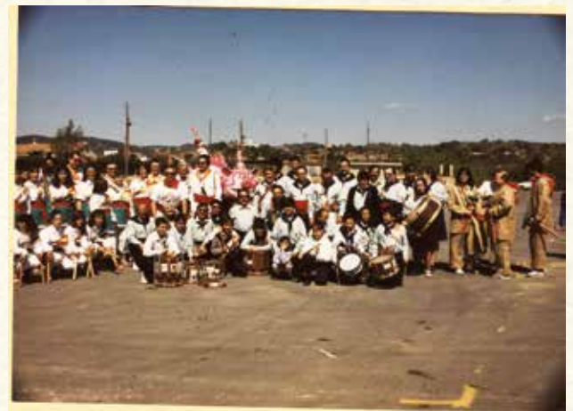
Estrena de la draga, la colla de diables i la colla de ball de bastons (1991). (Antoni Pineda).

ses obres teatrals d'elencs forans: l'Escutilló, de Vilanova i la Geltrú (1987), el GER de Sant Pere de Ribes (1985), L'Agrupació Benèfica Teatral de Tàrrrega (1983), el Foment Vilanoví (1984), Col·lectiu Krisol (1986) i el Xulius, de Sant Pere de Ribes (1988), però també la doble sessió que representà el flamant Grup de Teatre del Casal de Cultura, de Cubelles: Qui... compra maduixes i La vídua (1990). La ma-