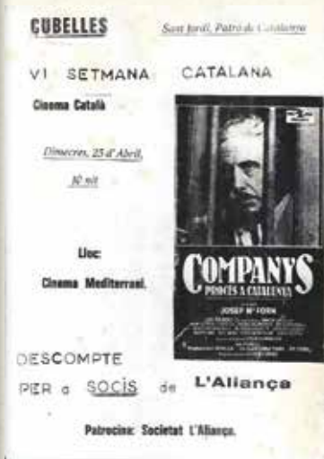
Un cartell de la Setmana Cultural de 1980. (Arxiu Joan Vidal).

Tots els dies tindrà lloc la venda de llibres.