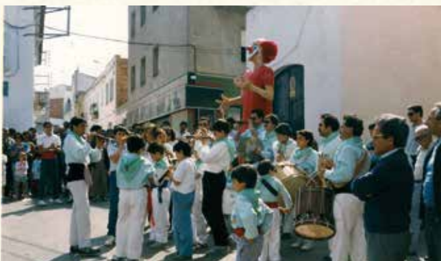
Presentació del gegantó Charlie Rivel (1987). (Antoni Pineda).