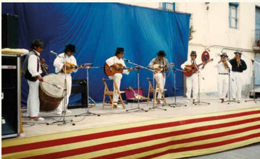
El grup inca Charijayac en el Festival de Música “Trobada de Cultures” (1990). (Antoni Pineda).

Gairebé totes aquestes xerrades van tenir lloc a la sala de la Societat L'Aliança, que també acollí diver-