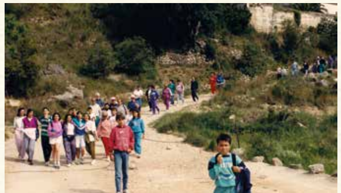
Una imatge de la II Caminada Popular, tornant de l'ermita de Lourdes (1992).