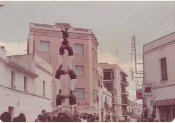
Els Castellers de Vilanova Colla de Mar a la plaça de la Font (1983). (Joan Vidal).