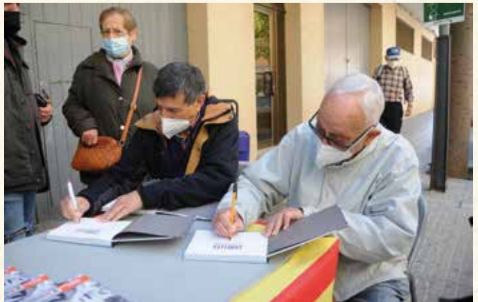
Els autors del 'Cubelles desapareguda' signant llibres en plena pandèmia. Sant Jordi de 2021. (Montse Torrado).