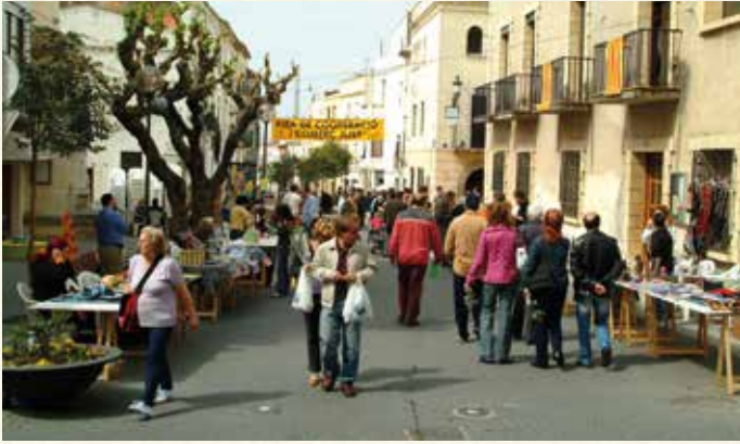
2a Fira de Comerç Just i Solidaritat (2005). (Montse Torrado).