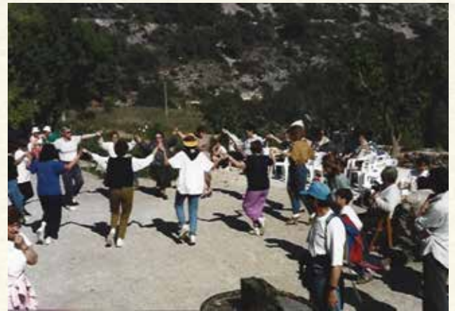
L'Aplec a Can Cucurella en la IV Caminada Popular (1994). (Antoni Pineda).