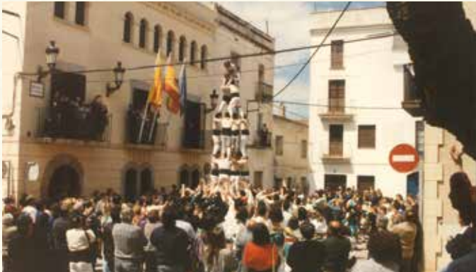
Actuació dels Bordegassos a la plaça de la Vila (1991). (Antoni Pineda).