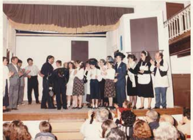
Els membres del Grup de Teatre del Casal de Cultura (1990). (Antoni Pineda).