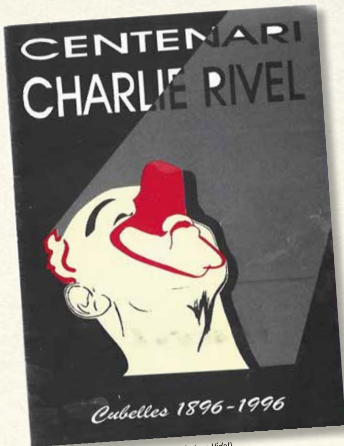
Cartell de la Setmana Cultural de 1996.