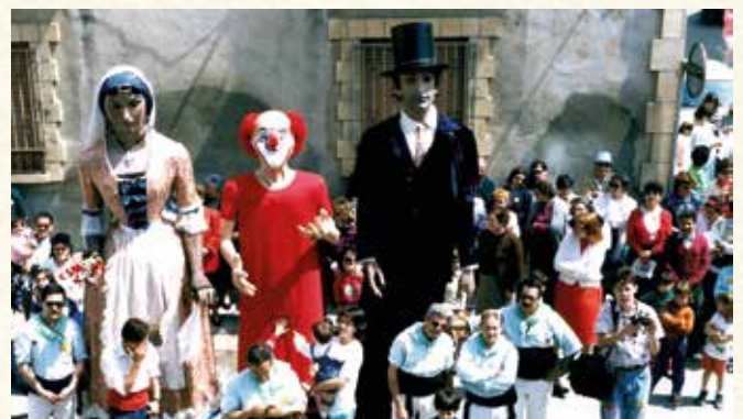
El gegantó Charlie Rivel, amb l'Abdon i l'Assumpta el dia de la seva estrena (1987). (Antoni Pineda).