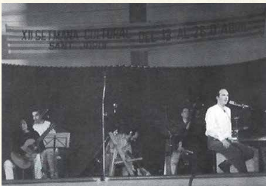
Lluís Llach durant el seu recital al Poliesportiu (1986).