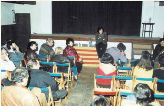
Conferència de Pilar Rahola a L'Aliança (1990). (Antoni Pineda).