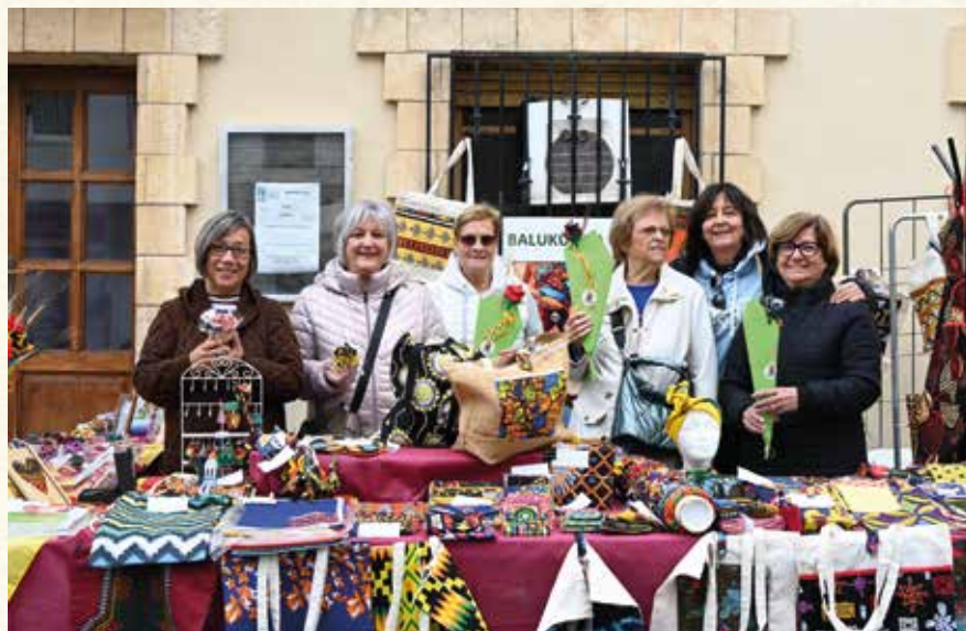
Parada de l'Associació Balukunda en la diada de Sant Jordi de 2024. (Montse Torrado).