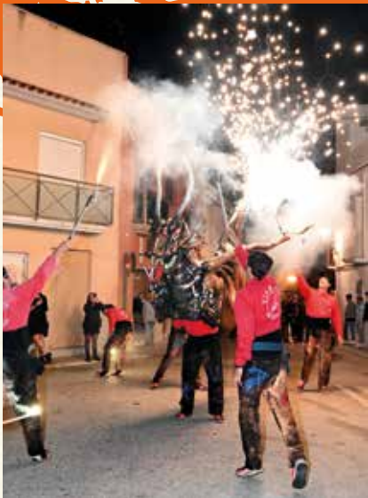
Els diables amb el Viagrot (2023). (Montse Torrado).