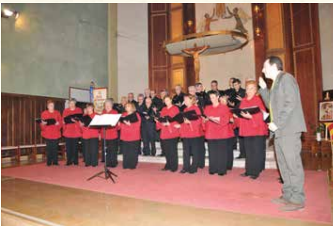
Actuació del Cor l'Espiga en el V Festival de Cant Coral (2010). (Montse Torrado).