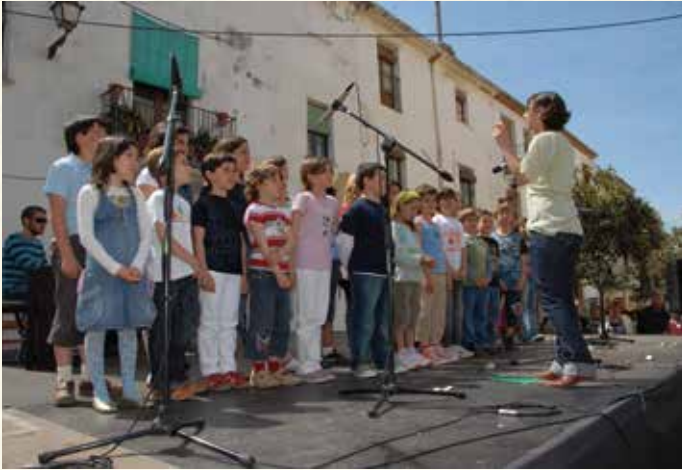
Cant coral a càrrec dels alumnes del taller de música Pizzicato (2008). (Montse Torrado).