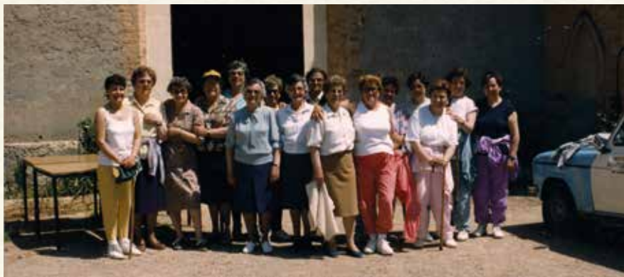
Grup de dones que assistí a l'aplec a l'ermita de Lourdes (1994).

Quatre anys més tard, el 1996, tornà a repetir-se la història amb motiu del centenari del naixement de Charlie Rivel, amb la particularitat que la totalitat d'actes de la Setmana