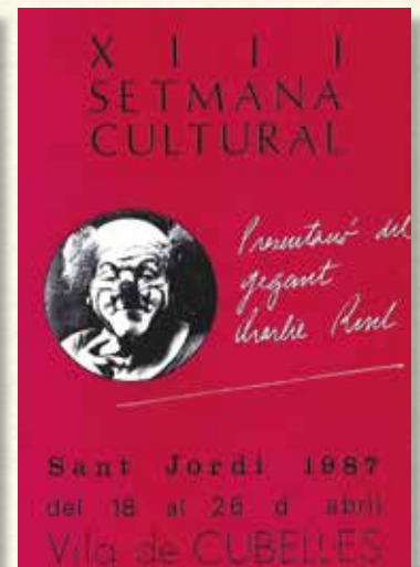
Cartell de la Setmana Cultural de 1987.