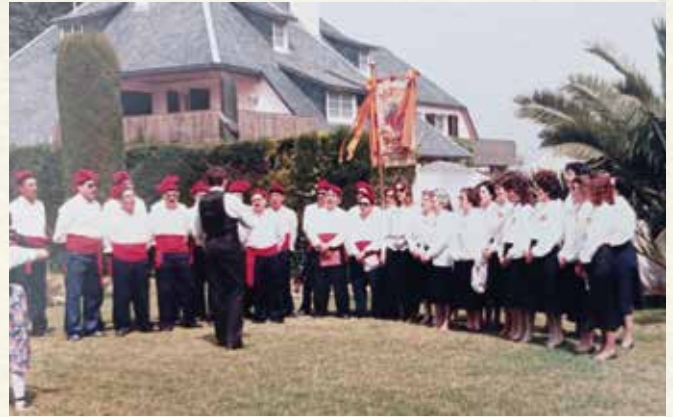
El Cor l'Espiga en la cantada de caramelles de 1987 al Restaurant Llicorella. (Antoni Pineda).