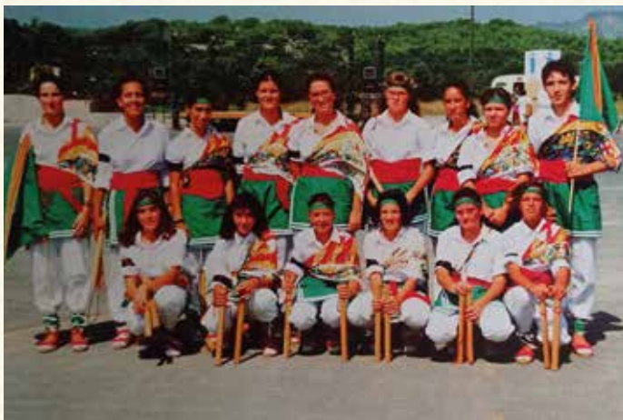
La colla de bastoneres, el dia de la seva presentació (1991). (Antoni Pineda).