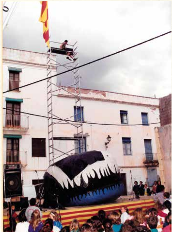
Una altra imatge de l'espectacle de Tortell Poltrona el 1989. (Antoni Pineda).