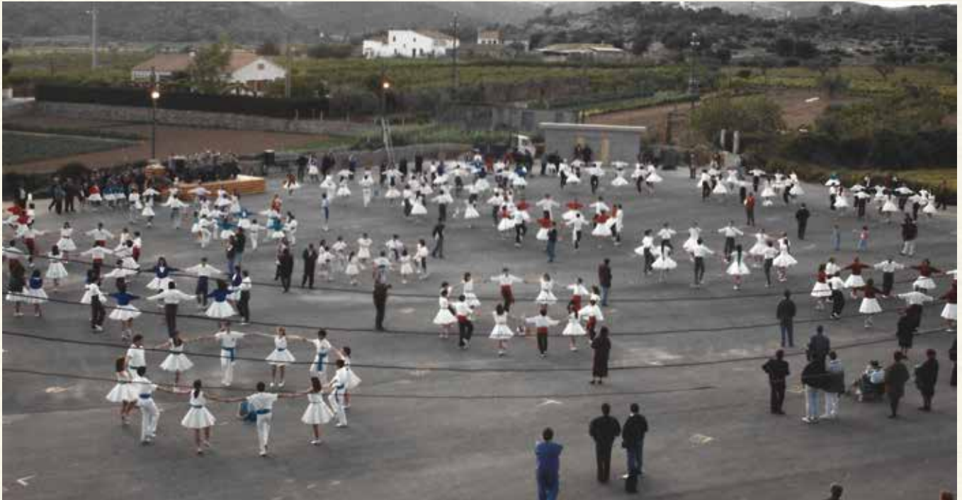
Una imatge del III Concurs Nacional de Colles Sardanistes (1991). (Antoni Pineda).