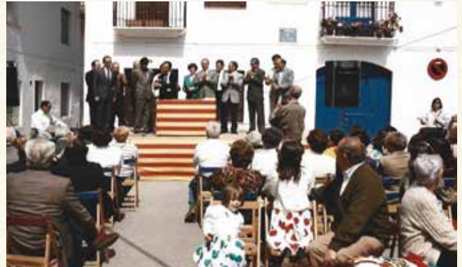
Acte protocol·lari d'agermanament entre Arles de Tec i Cubelles (1992). (Antoni Pineda).