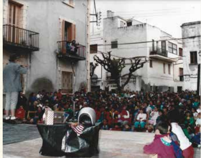
Actuació de Tortell Poltrona a la plaça de la Vila (1989). (Antoni Pineda).