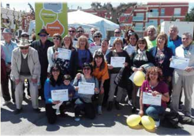
Commemoració del desè aniversari del Voluntariat de la Llengua a la plaça de la Sardana, amb voluntaris i entitats adherides (2018). (Montse Torrado).