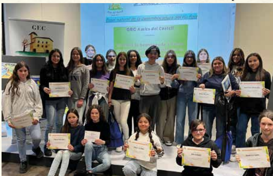
Les participants al Concurs de Dibuix del GEC Amics del Castell (2024). (Montse Torrado).

I és que, com cantava Vicenç Andrés Estellés, de qui aquest 2024 es commemora el centenari del seu naixement, "Allò que val és la consciència de no ser res si no s'és poble".