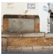
3 Fontaine de la rue Sant Antoni, fontaine avec abreuvoir