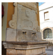
2 Fontaine de la rue Major, Font de Lleó