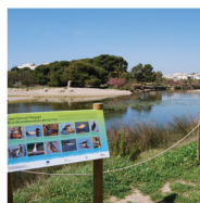
6 Espace naturel de l'embouchure du fleuve Foix