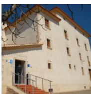
1 Château de Cubelles