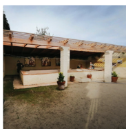
5 Lavoirs municipaux