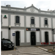
3 Gare de Cubelles