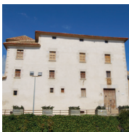
1 Château de Cubelles