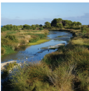
6 Espace naturel de l'embouchure du fleuve Foix