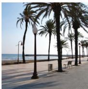
5 Promenade maritime