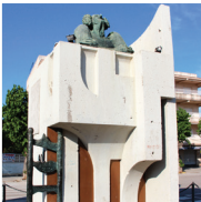
4 Monument à Charlie Rivel