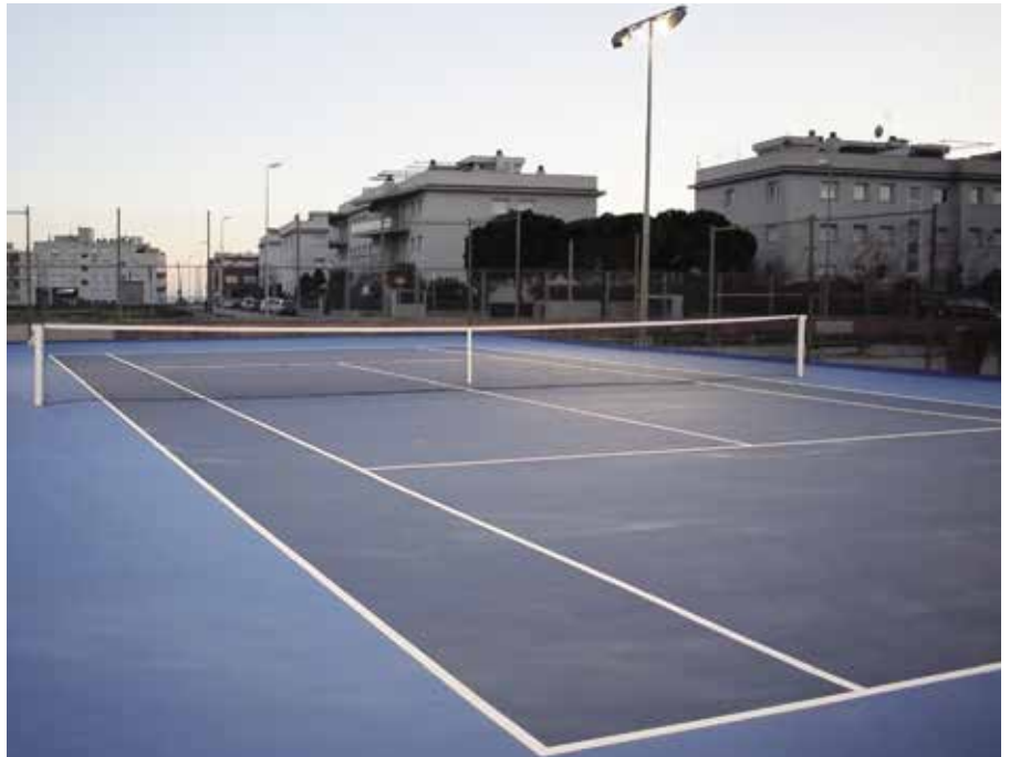
La nova pista de tennis es va construir arran de la primera edició dels pressupostos.

Els majors de 16 anys triaran amb el seu vot les inversions dels dos pròxims anys