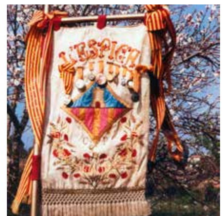
L'estendard del Cor l'Espiga

Però aquyests no seran els únics actes que celebrarà la coral. El 8 de març, a l'església (12 h.), tindrà lloc l'assaig-concert amb un coro japonès, de gira pel nostre país. El 12 d'abril se celebren les tradicionals caramelles i 26 el festival de Cant coral Vila de Cubelles, entre d'altres. El 12 de juliol es farà una sortida a Montserrat, on el Cor espera poder cantar a l'interior de la basílica. I al desembre encara està per determinar la data del concert de Nadal. ●