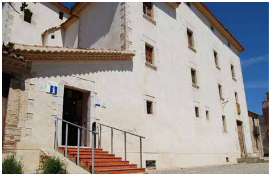
El castell allotja l'Oficina de Turisme i l'exposició del pallasso Charlie Rivel.

merç i fires, a partir d'aquesta jornada continua el projecte d'establir un contacte directe amb les empreses locals per apropar i donar a conèixer el patrimoni local de la vila, que es preveu se segueixi executant amb més accions i iniciatives en els propers mesos. Entre aquestes activitats s'aposta per difondre el patrimoni arquitectònic i natural. ●