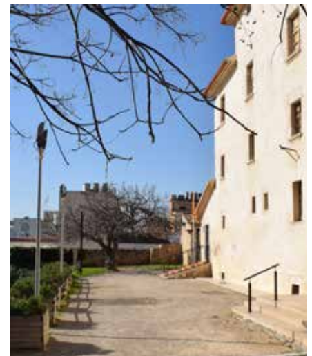
L'espai doblaria les seves dimensions.