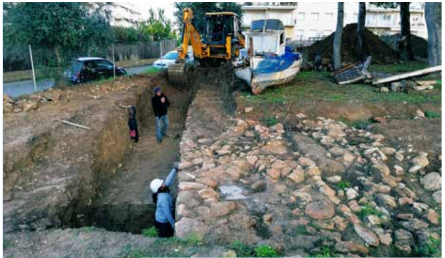
Darrers treballs d'excavació al jaciment de la Mota.

Les imatges podrien confirmar, també, l'existència d'un port púnic al Foix