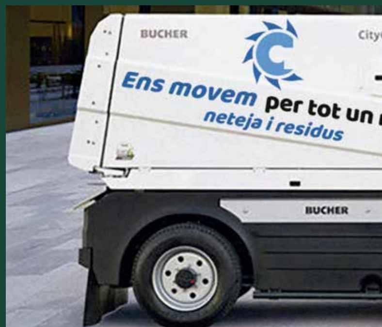
L'1,85% del nou contracte del servei de la neteja es dedicarà a campanyes

El logotip de la campanya combina la lletra C, de Cubelles, amb el símbol de la fletxa circular amb la que s'identifiquen les accions de reciclatge. A partir d'aquí, la lletra/símbol és envoltada per unes formes geomè-