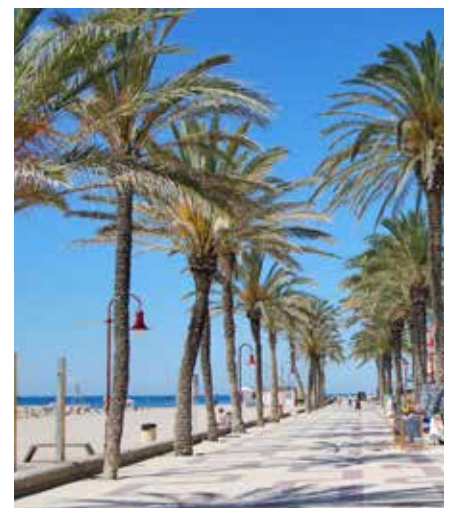
Platja Llarga i passeig Marítim.

L'acte d'entrega dels distintius, que va tenir lloc el 13 de febrer, va guardonar dos equipaments municipals com són l'oficina municipal de Turisme i l'exposició permanent del pallasso Charlie Rivel, ambdós ubicades al castell. També van rebre el distintiu la platja Llarga i la platja de la Mota de Sant Pere, a banda del càmping La Rueda en categoria d'empreses locals. ●