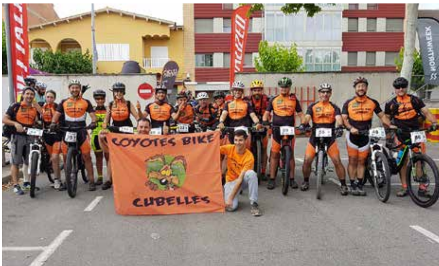
El club ja suma una quarantena de socis i aposta per establir-se.

Els responsables de l'entitat asseguren que estant molt contents amb aquests primers anys i consideren que, per mantenir aquest bon funci-