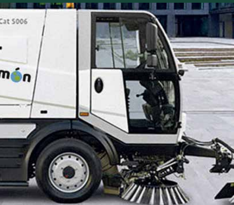
de sensibilització mediambientals i de promoció de l'ús d'energies netes.

El primer contacte de la ciutadania amb el lema Ens movem per tot un món serà a través de la nova maquinària del servei de neteja viària. Els nous vehicles, que portaran retolat el distintiu de la campanya, destaquen per generar uns nivells sonors més baixos i per una major eficàcia i eficiència. Pel que fa a les novetats del nou servei de neteja viària, s'incorpora la neteja amb aigua i s'inclou la neteja especial, prèvia i posterior, en festes populars; la recollida d'animals morts a la via pública; la intervenció immediata en casos urgents i emergències meteorològiques; la neteja i desinfecció dels correcans; la cura preventiva d'embornals i reixes... ●