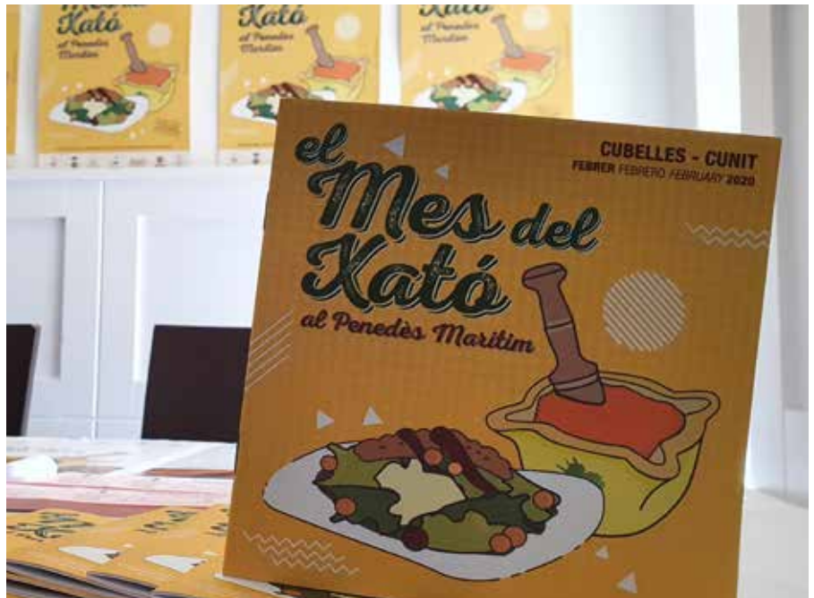
Portada del llibret del Mes del Xató al Penedès Marítim 2020, el dia de la presentació.

Tots els qui degustin un menú de xató en algun dels 21 establiments col·laboradors s'enduran una entrada gratuïta vàlida per al mes de febrer a l'Exposició permanent del pallaso Charlie Rivel. També se sortejaran 21 àpats gratuïts per a dues persones entre els qui sege-