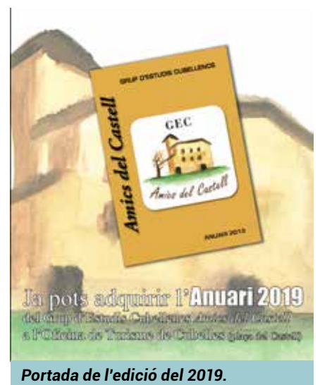
Portada de l'edició del 2019.