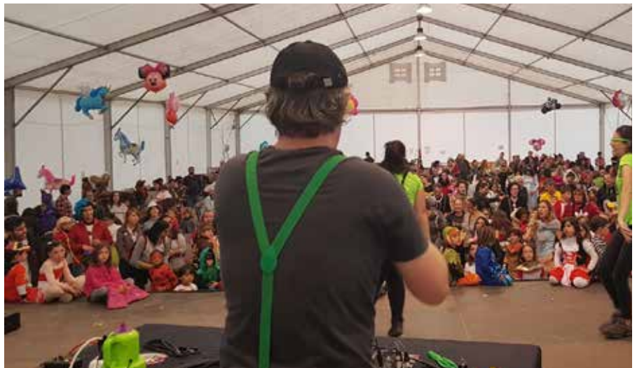
Els més joves seran els protagonistes de bona part de la programació.

El programa, amb un marcat accent familiar, comença el 21 de febrer