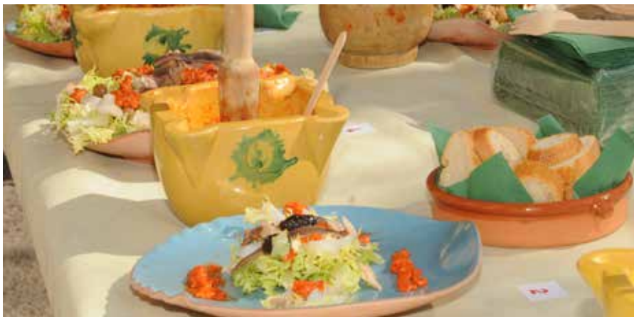
Mostra de plats participants al concurs de mestres xatonaires de l'edició 2019.

El Mes del Xató compta novament amb la col·laboració de l'agència de desenvolupament econòmic NODE Garraf i del projecte Xarxa Productes de la Terra, una proposta que dona suport a persones que es dediquen professionalment a produir i transformar productes alimentaris lligats al territori amb criteris de qualitat i proximitat. ●