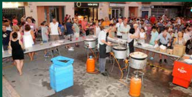
La Musclada popular aplega centenars de persones.