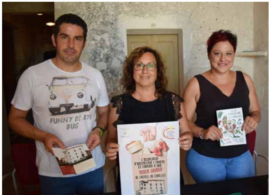
La campanya es va presentar al mateix Castell de Cubelles.

AHCC s'emmarca en d'altres que la regidoria ha impulsat a nivell de consum perquè els clients dels comerços locals demanin el tiquet de compra. ●