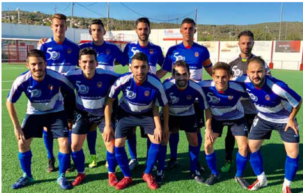
Onze titular que es va imposar al camp del Roda de Barà remuntant un gol en contra.

igualat. Els locals es van avançar en els primers minuts i els tarragonins van empatar a l'inici de la segona part. Quan faltaven deu minuts per al final, Adrià Robert va resoldre el