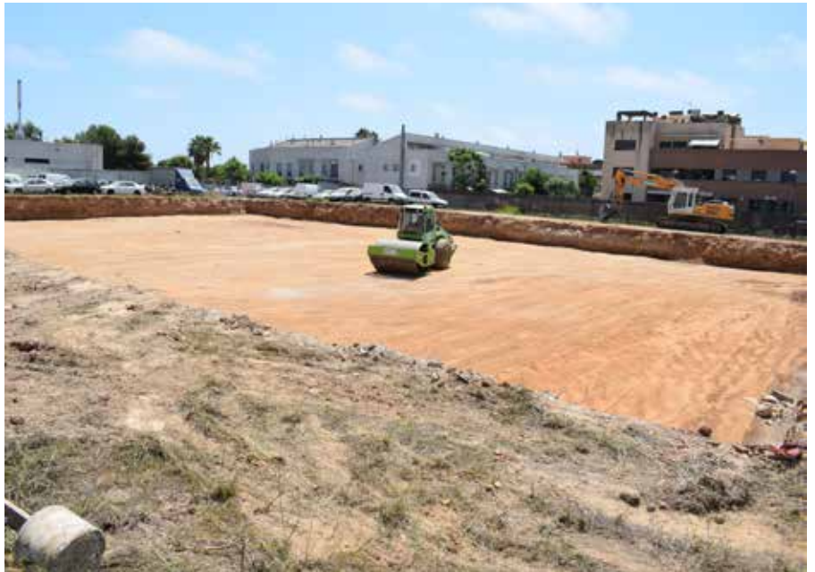
La maquinària treballa en la fonamentació de l'edifici que acollirà la nova biblioteca.

El següent pas serà la instal·lació de l'estructura metàl·lica de l'edifici, un element que s'està construint en una nau i que posteriorment es traslladarà a la parcel·la on s'encabirà el nou equipament cultural i social, ubicat just darrere de la comissaria de la Policia Local, entre els carrers Ciutat de Barcelona i Verge de Montserrat. Es preveu que als voltants de l'època de Nadal d'enguany ja s'hagi executat el 40% de l'obra, que s'allargarà fins la tardor del 2020 segons la planificació del projecte, que contempla 14 mesos de treballs. Tenint en compte les ordenances municipals i les excepcions previstes però, durant el mes d'agost s'aturaran les obres durant una setmana encara per determinar. Un cop hagi