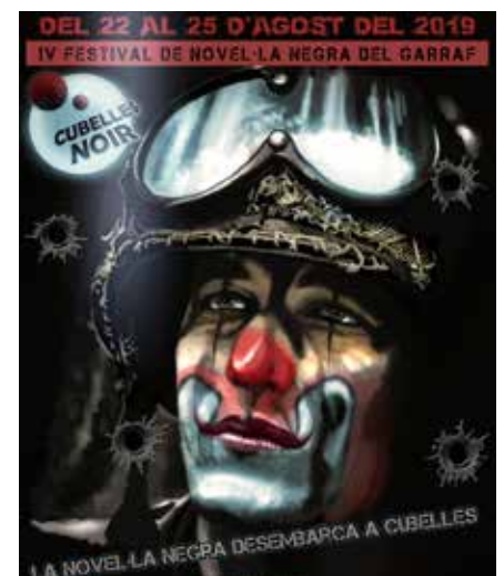
Cartell d'enguany, de Jou Monsó.