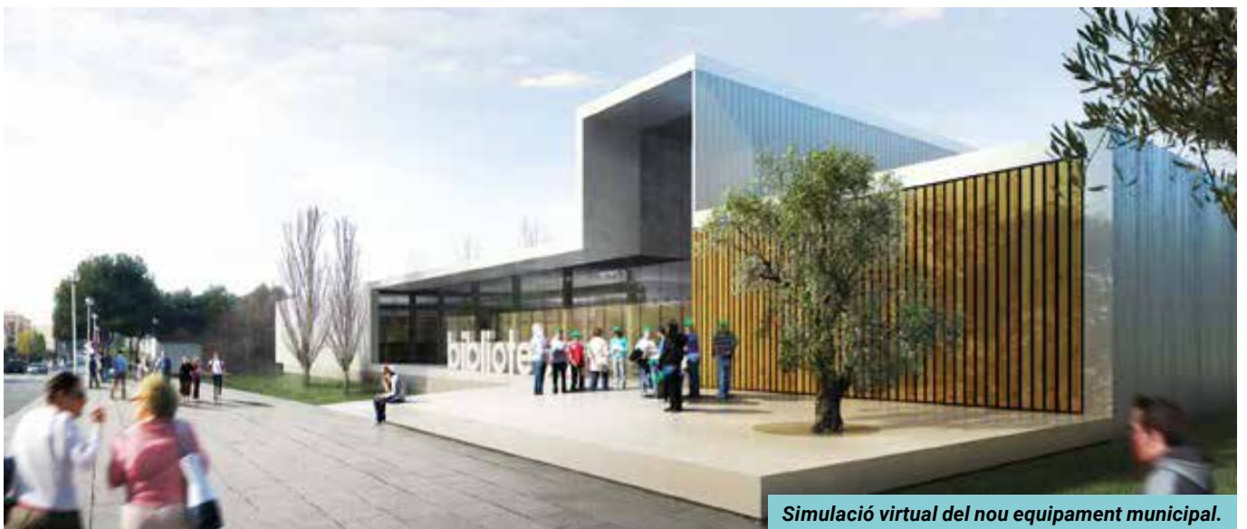
Simulació virtual del nou equipament municipal.

blioteca les executa l'empresa Artifex Infraestructures SL, que ha estat l'escollida entre les sis que concorrien al concurs públic de licitació. El pressupost total és de 2.051.221 euros més IVA, el que representa una rebaixa respecte al preu de sortida de gairebé un 15%. A més, en l'equipament han ofert millores per valor d'11.900 euros i 31.718,34 euros en millores de l'entorn. ●