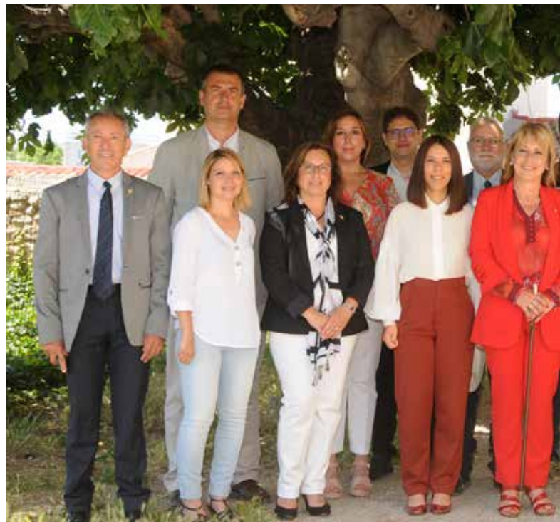
El nou consistori per al 2019-2023, a la plaça del Castell.

Dels comicis electorals va sorgir una composició consistorial formada per sis grups municipals: Unitat Cubellenca 11 (6), Partit dels Socialistes de Catalunya (3), Esquerra Republicana de Catalunya (2), Ciutadans (2), Junts per Cubelles (2), Cubelles en Comú Podem (1) i la CUP Cubelles (1). Això representa una reducció de dos grups municipals, respecte al mandat 2015-2019, amb l'entrada per primer cop de Ciutadans, Cubelles en Comú