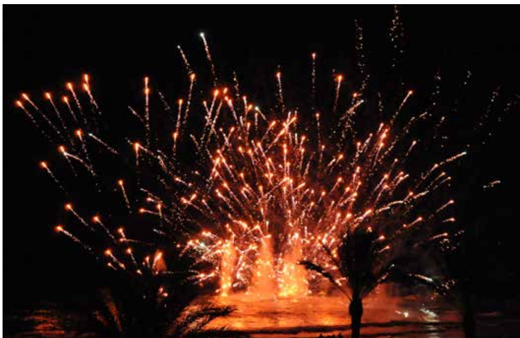
El castell de focs la nit del 14 d'agost serà novament un dels principals reclams.

i històricament vinculat a la festa dels Tres Tombs. El programa complet pot consultar-se al web municipal www.cubelles.cat . ●