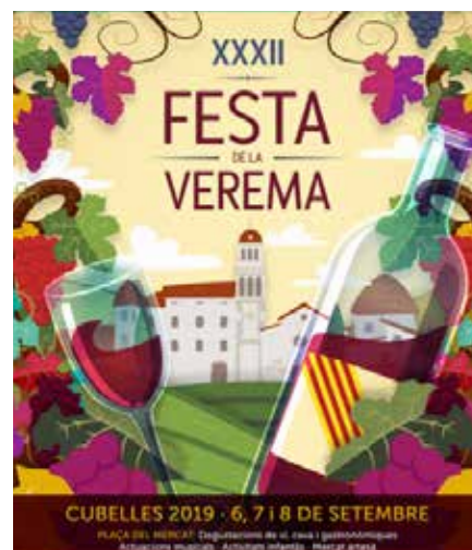
Cartell de la Festa de la Verema 2019.

La XXXII Festa de la Verema es durà a terme els dies 6, 7 i 8 de setembre a la plaça del Mercat on s'hi ubicaran els diversos estands de cellers, vinoteques i restauradors locals, a més de l'escenari on tindran lloc tots els concerts. Tota la informació es pot consultar al web municipal. ●