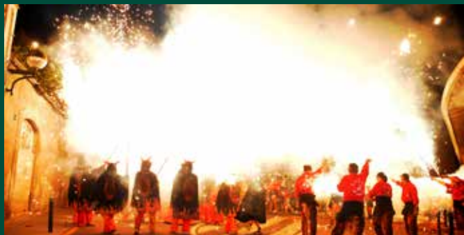
El Correfoc, un dels plats principals de la Festa Major petita.

L'endemà, 28 de juliol, tindrà lloc la 35a trobada de gegants que recorreran en cercavila pels carrers del municipi des de la plaça dels pobles d'Espanya fins la plaça de la Vila on es farà la ballada conjunta de totes les figures participants arribades de tot Catalunya. La jornada de diumenge es completarà amb un nou sopar de germanor a la plaça del Centre Social i la tradicional cantada d'havaneres que anirà a càrrec del grup Son de