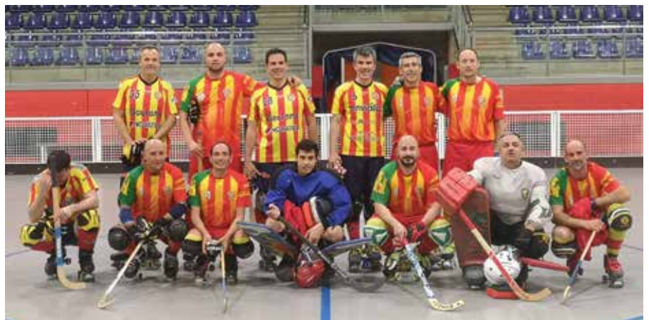
Alineació dels veterans, encara formant part del CP Cubelles.

La temporada enguany dels veterans ha estat marcada per les lesions, uns entrebancs que han impedit complir amb les expectatives generades a començaments d'any, quan l'equip aspirava a esdevenir