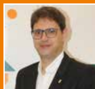
RAÛL MUDARRA I CARMONA | UC11 2n Tinent d'Alcaldia d'Hisenda, Contractació i Comunicació.