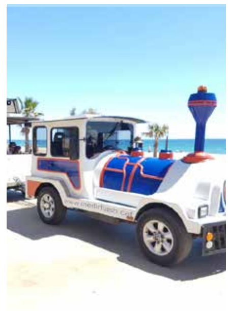
El trenet de Cubelles.

De cara a properes temporades, la regidoria de Turisme estudiarà alternatives per recuperar una atracció molt esperada per la majoria de vilatans. ●