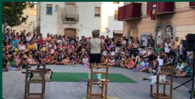
Centenars d'infants tornaran a omplir carrers i places.

Si bé els espectacles itinerants pels passejos marí-tims es faran entre les 11.00 i les 13.00 hores, el gruix de la resta d'actuacions tindran lloc durant la tarda i fins ben entrada la nit. Donaran inici a les 17.30 hores i la mostra clourà a les 23.30 hores a la plaça del Mercat, on s'hauran traslladat les actuacions des de les 20.55 hores. Els horaris i la resta d'informació ampliada de tots els actes de l'programa de Festa Major petita i la Mostra de pallassos poden consultar-se al web municipal www.cubelles.cat o a través dels perfils municipals a les xarxes socials (Twitter i Facebook). ●