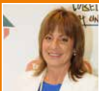
ROSA FONOLL I VENTURA | UC11 Alcaldesa. Urbanisme, Seguretat Ciutadana i Programes d'integració europea.