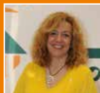
ESTER SOLER I TERUEL | ERC 3a Tinent d'Alcaldia de Cultura i Ensenyament.