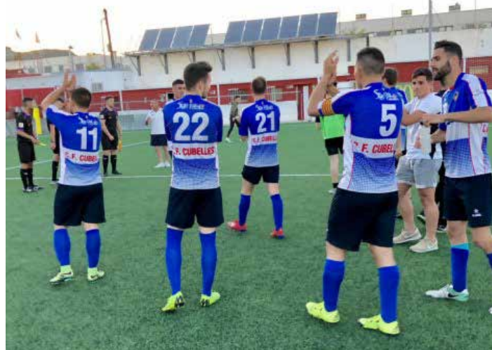
Els cubellencs confien en repetir els èxits del darrer any.

Tot i que la plantilla no està tancada, la idea dels tècnics és mantenir el bloc actual i fer poques incorporacions. La nova temporada arrencarà el 8 d'agost amb els entrenaments de pretemporada. ●