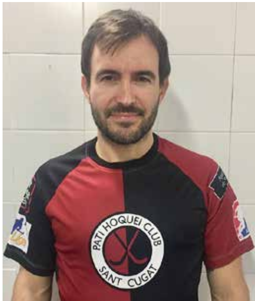
Foto oficial amb la samarreta del Sant Cugat.