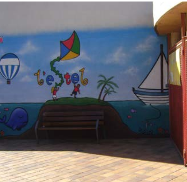
L'antiga Ilar L'Estel serà el nou Espai Jove

Ja es disposa del pla d'usos i ara caldrà fer el projecte i les obres