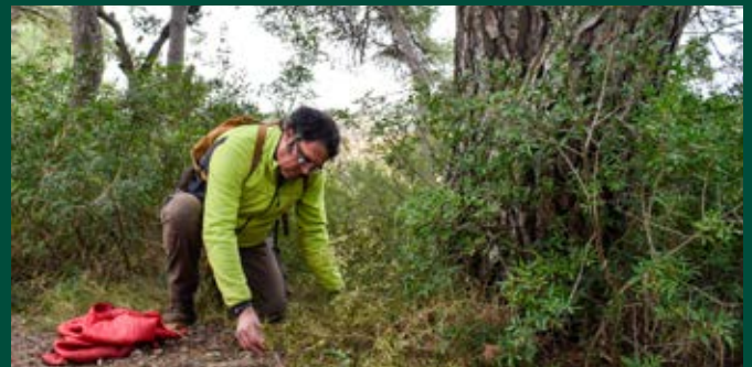
Les activitats de l'entitat són obertes a tota la població.

De cara al futur, l'associació s'ha posat com a repte augmentar la col·laboració amb les escoles i repetir la xifra de 900 roures plantats al llarg de l'any passat. Així mateix, es vol prosseguir amb les tasques de col·laboració en la recuperació dels Ortolls i continuar amb la tasca de custòdia i protecció d'altres terrenys ubicats a Vilanova i Cunit. Qui vulgui contactar-hi, els pot trobar a les xarxes socials o bé assistir a alguna de les seves jornades de treball. Gairebé cada diumenge, a les 9.00 h., es concentren a la plaça del Mercat, des d'on es desplacen per dur a terme les seves jornades de treball. ●