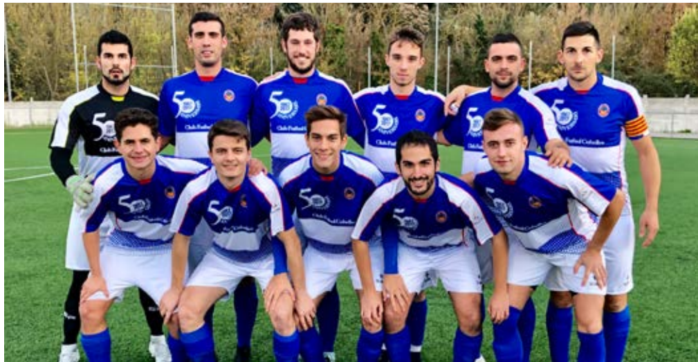
El CF Cubelles podria tornar aquesta temporada a la 2a Catalana per segon cop.

da, el femení del Club Vòlei Cubelles està disputant la fase d'ascens, una lligueta de vuit equips a doble partit que decidirà qui puja a tercera catalana. En les primeres tres jor-