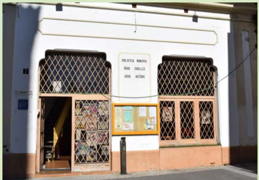
L'edifici del Casal de Cultura acollirà l'edifici de Comunicació de Cubelles quan la Biblioteca Mossèn Joan Avinyó es traslladi.

El Pla funcional en el que es basarà el projecte, contempla les necessitats que haurà de complir el document per afrontar una reforma quan la biblioteca es traslladi a la seva nova ubicació, al Bardají Vilanova. Així, la planta baixa estaria ocupada per la redacció i els estudis tècnics i de locució dels mitjans de comunicació municipals. En aquest sentit, és important preveure la futura ampliació de les necessitats dels mitjans, que treballen en un projecte de convergència de redaccions dels diferents canals, tant l'escrit, com el sonor i el visual. ●