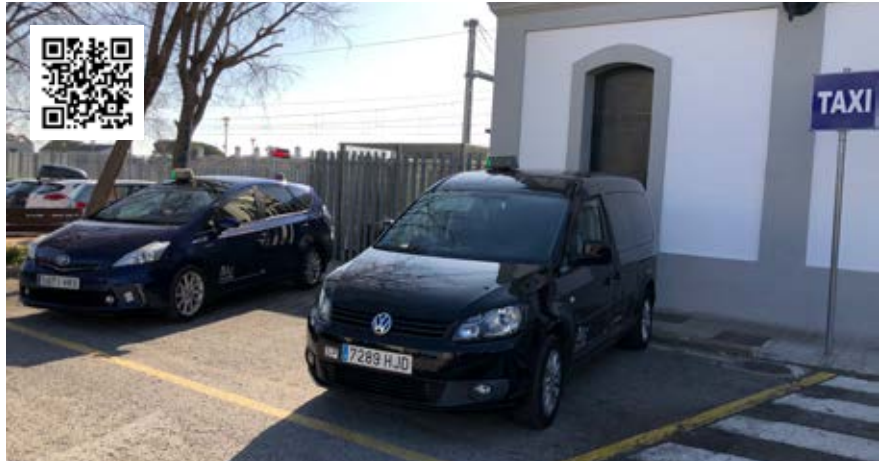
Els taxis tenen la seva base a la plaça d'Antoni Pineda i Gavalrà, a l'estació

Amb aquests canvis, els titulars de les llicències de taxi de Cubelles pretenen millorar el servei que s'ofereix a la ciutadania, en especial pel que fa referència a la central de reserves que era un dels aspectes menys valorats pels clients. Així mateix, la nova plataforma digital