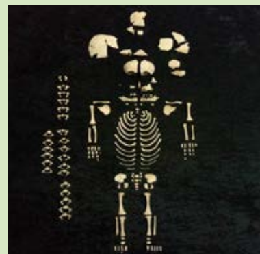
Es faran proves d'ADN a l'infant trobat a les excavacions La Mota.