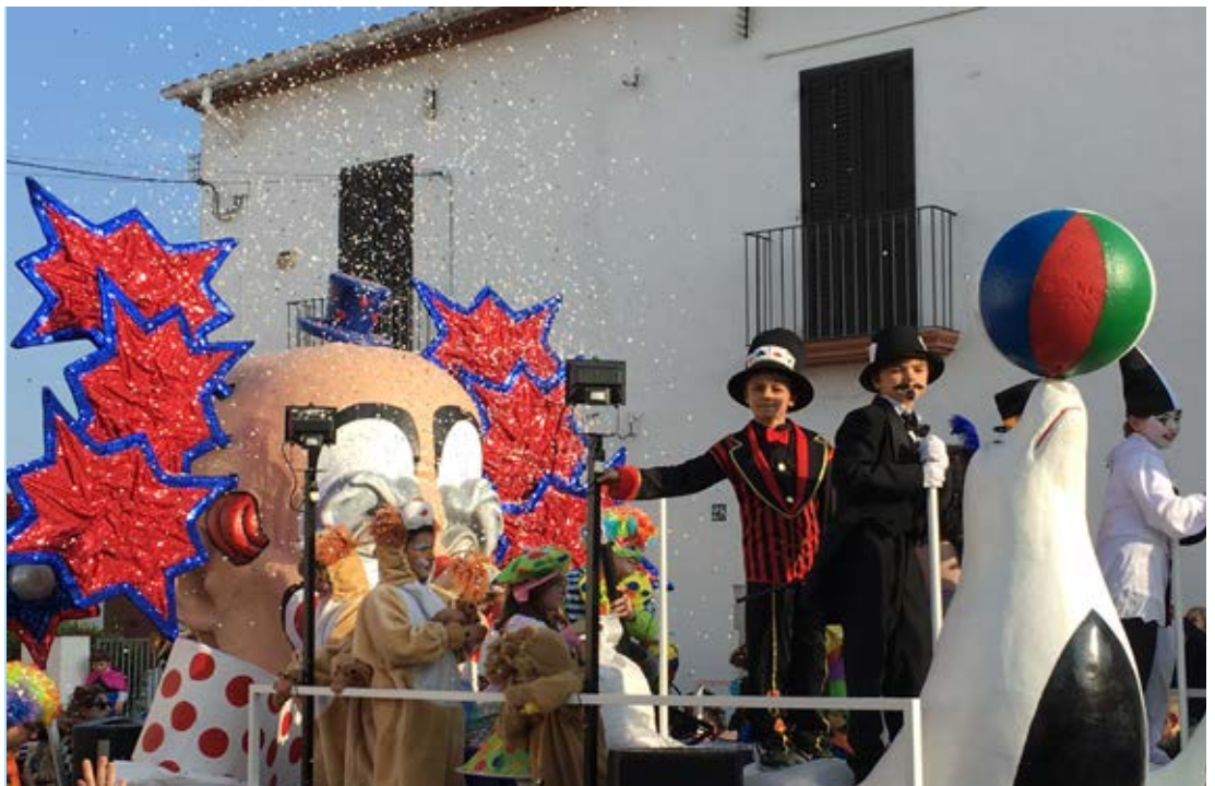
Els nens i nenes són els grans protagonistes del programa d'actes del Carnaval cubellenc.

El programa d'actes complet pot consultar-se al web municipal www.cubelles.cat i als perfils municipals a les xarxes socials. La rua de dissabte de Carnaval també podrà seguir-se a Canal Blau i, els dies posteriors, tornar a visionar-se al seu web www.canalblau.cat . ●