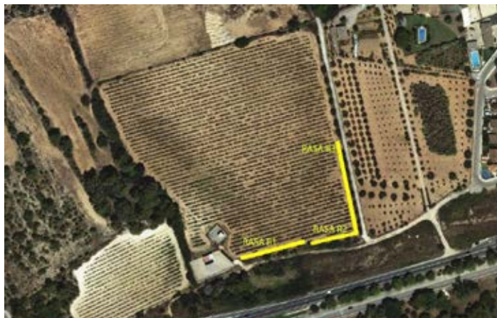
Plànol de les excavacions a Mas Guineu.