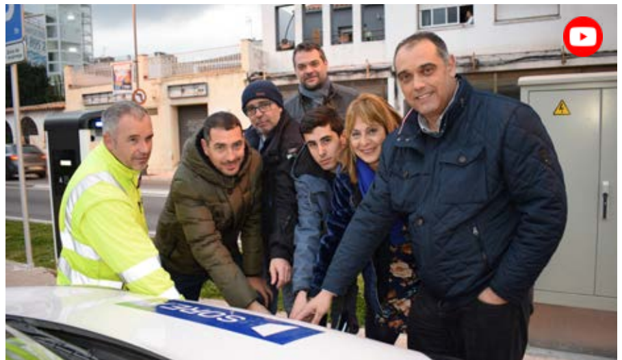
El punt de recàrrega és del sistema semiràpid, que carrega el vehicle en una hora

sada, dos veïns de la vila ja van poder fer ús de l'estació de recàrrega amb els seus vehicles, un turisme i un ciclomotor. Ambdós van poder expressar als assistents i mitjans de comunicació els beneficis, tant ambientals com econòmics, que tenen aquests vehicles per al present de la mobilitat. ●