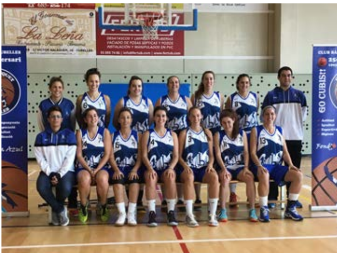
El CB Cubelles podria jugar la fase d'ascens a Primera.

Pel que fa al masculí del C.P. Cubelles, està en la desena posició al grup D de la segona catalana lluitant per escalar alguna posició més abans de finalitzar la temporada. ●