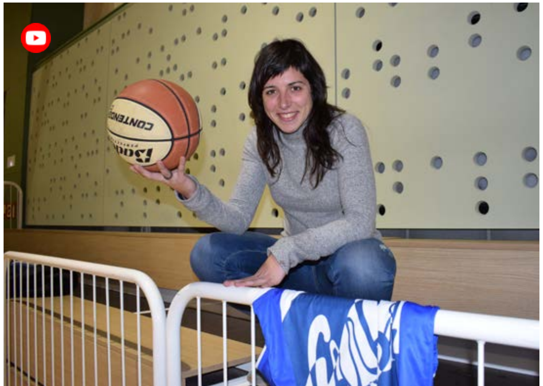
Amb experiència en categories superiors, Mateos s'ha implicat a fons amb el club.

casualitat. "L'any passat era el debut a la categoria però ara el guiu de plantilla ja té un rodatge important i no es pot considerar que sigui una sorpresa", assegura. Seriosa,