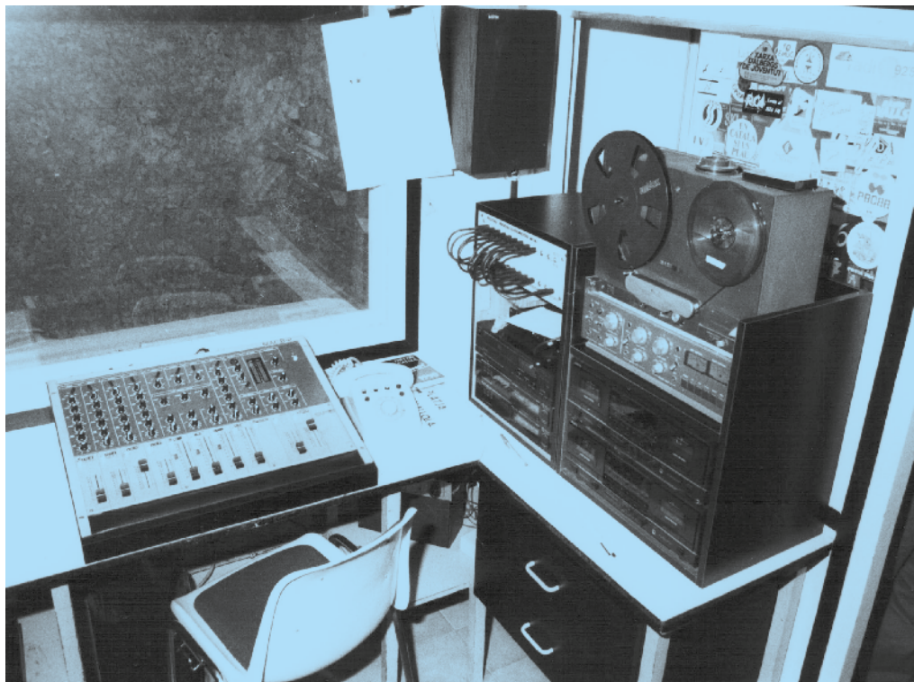
Imatge històrica de l'estudi principal de Ràdio Cubelles, al carrer Colom.

que, per donar obertura a l'acte de lliurament d'aquests guardons, es comptarà amb la presència del periodista Antoni Bassas, actualment