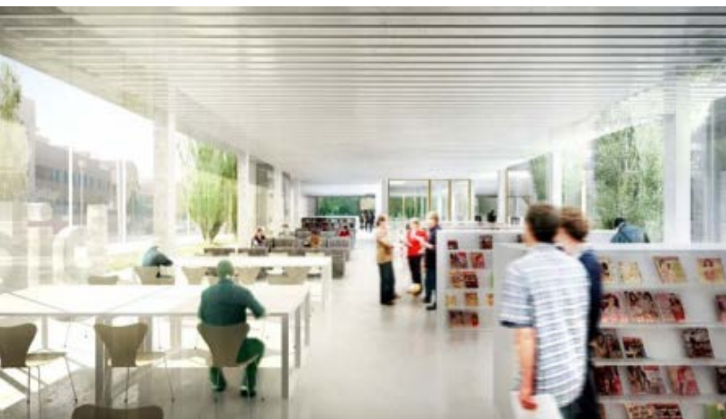
L'adjudicatari també ha reduït en 4 mesos el termini d'execució.

Un cop adjudicat el projecte, s'ha endegat el procediment administratiu corresponent per tal de poder dur a terme la signatura protocol·lària corresponent, programar l'acta de replanteig i iniciar formalment les obres, que tenen una durada aproximada de 14 mesos. En aquest aspecte l'adjudicatari també ha presentat una millora al termini inicial que era de 18 mesos. Així mateix, la garantia s'ha incrementat a proposta d'Artífex Infraestructures fins als quatre anys, quan la garantia de l'oferta de paltejada a nivell municipal era d'un any. ●