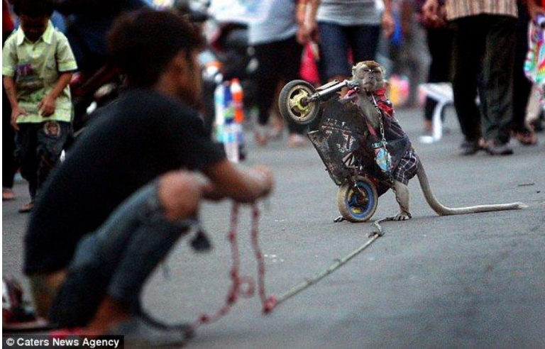
Mico fent un espectacle pels turistes.

que només puguin treure la llengua. Per aquesta raó, les serps pateixen infeccions i moren.