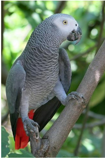
Lloro gris africà.

humans. Arriba fins als 33cm de llargària i als 450g de pes i habita en selves humides.