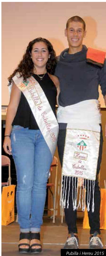
Pubilla i Hereu 2015