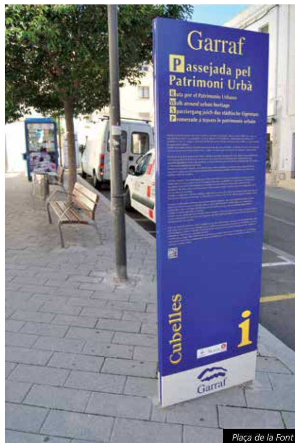
Plaça de la Font