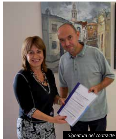
Signatura del contracte

L'Ajuntament de Cubelles ha signat els contractes per la prestació de serveis de monitoratge de diverses activitats per al Casal D'avis municipal adreçats a la gent gran. Amb l'empresa Asociación Esport 3 s'ha signat els tallers de memòria (7.167 euros), gimnàstica, ioga, country i ball en línia (17.519 euros) i manualitats i pintura (8.123 euros). Amb l'empresa Doble Via s'ha adjudicat s'han contractat les activitats de castanyoles i sevillanes (4.738 euros) i tall i confecció (4.473 euros). Els dos contractes són per dos anys, podent-se prorrogar per dues anualitats més.