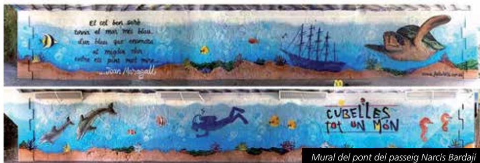
Mural del pont del passeig Narcís Bardagi

tasca dels grafiters des del punt de vista d'especialitat artística, més que no pas com l'acte vandàlic que es realitza en alguns casos i que suposen la brutícia de l'espai públic.