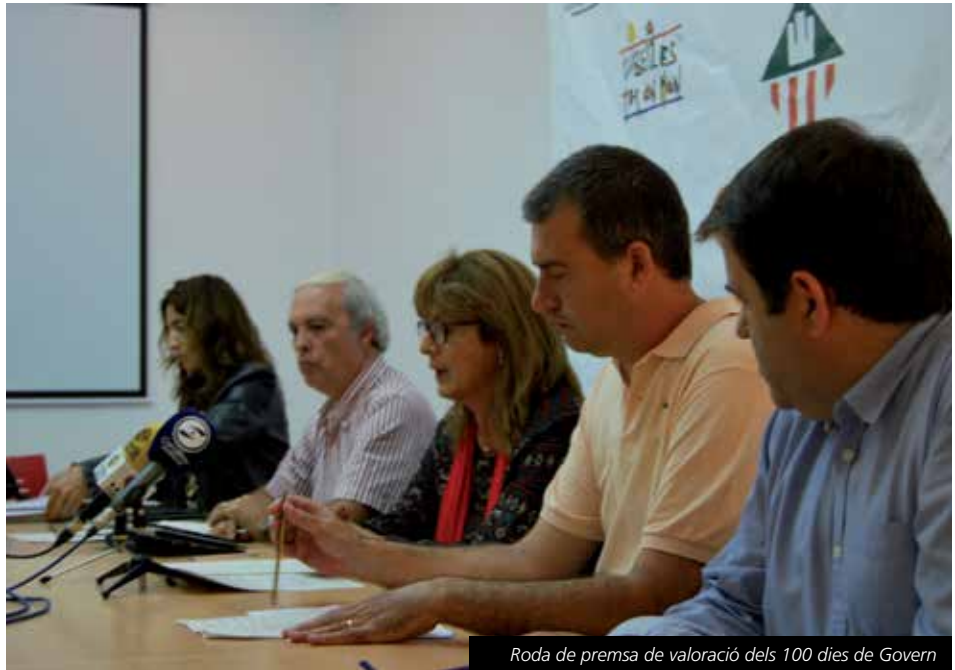
Roda de premsa de valoració dels 100 dies de Govern