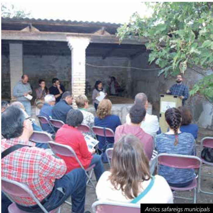
Antics safareigs municipals

Cubelles va participar amb un calendari d'activitats adreçades a la ciutadania