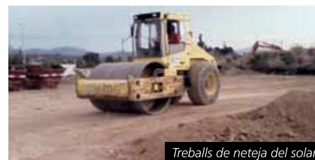
Treballs de neteja del solar

D'altra banda, l'Ajuntament també ha reparat la canonada que dona aigua a les dutxes de la Platja Llarga.