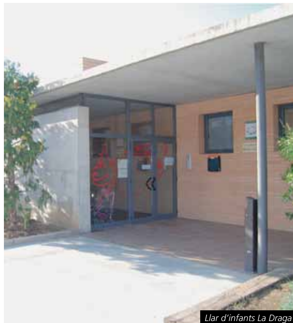
Llar d'infants La Draga