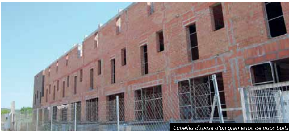
Cubelles disposa d'un gran estoc de pisos buits

Coincidint amb l'efemèride, properament una delegació de l'Ajuntament de Cubelles es desplaçarà a Arles per trobar-se amb els seus homòlegs nordcatalans.