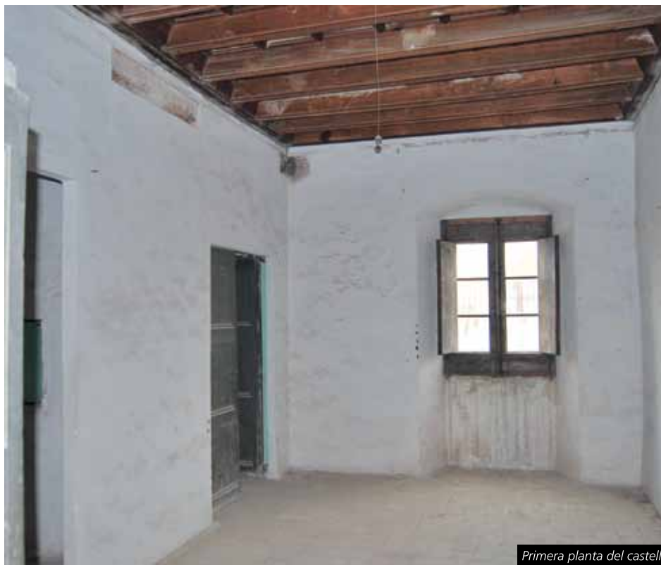
Primera planta del castell

i segona planta de l'interior de l'edifici, de tal manera que aquest pugui ser visitable, i mínimament a la plaça. Tot i això, cal cercar el finançament necessari per poder executar les obres, cosa a la que la Diputació s'ha mostrat oberta a col·laborar.