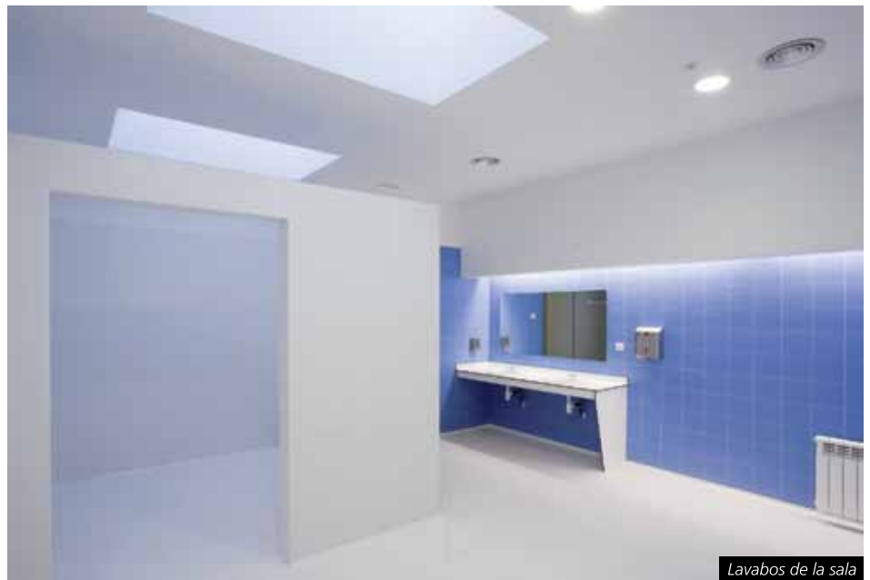
Lavabos de la sala