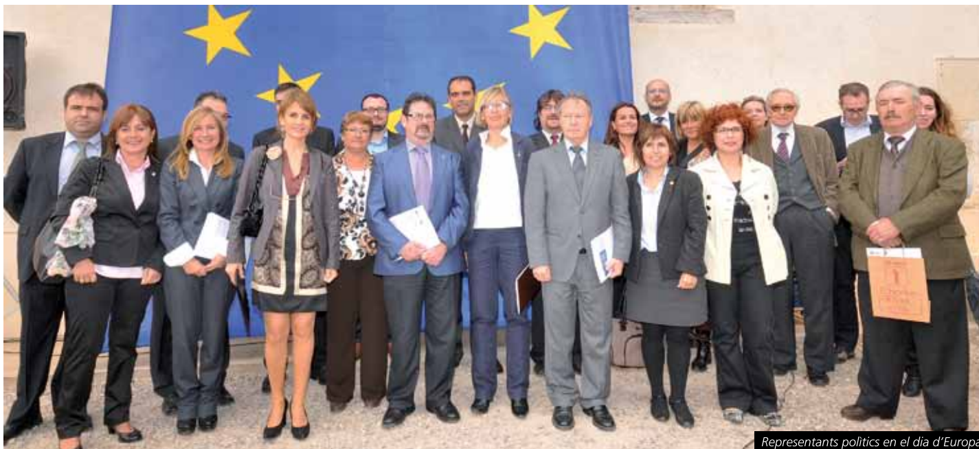
Representants polítics en el dia d'Europa

El document ressalta que "l'estratègia socioeconòmica EUROPA 2020 i les reformes anunciades han de servir fonamentalment perquè la Unió Europea trobi solucions basades en el consens social i polític per avançar en un model de desenvolupament més intel·ligent, sostenible i integrador socialment".