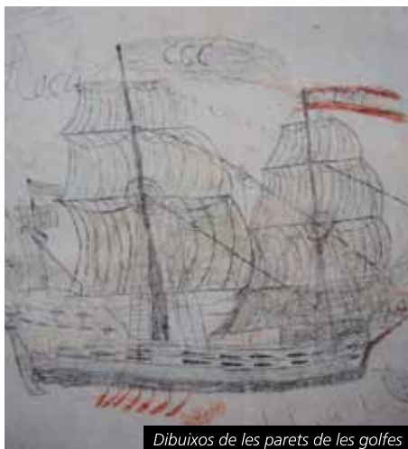
Dibuixos de les parets de les golfes