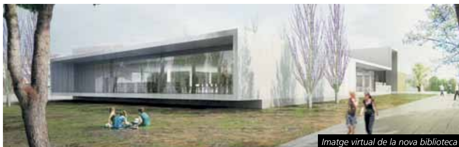
Imatge virtual de la nova biblioteca

Dins d'aquesta convocatòria es gestiona també l'ajut individual de menjador escolar, que té com a objectiu ajudar a l'escolarització dels nens i nenes que cursin educació infantil, primària i secundària obligatòria i als quals no els hi correspon la gratuïtat del servei de menjador escolar.