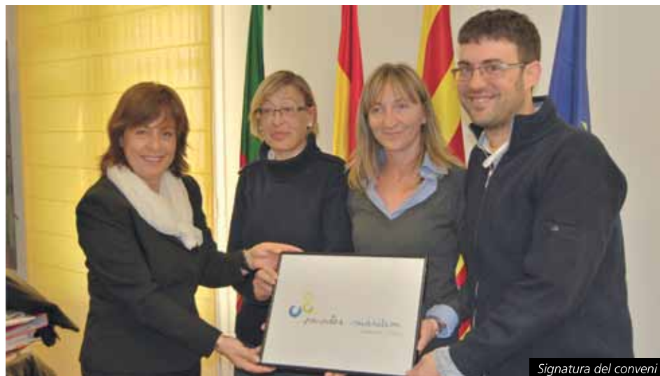
Signatura del conveni