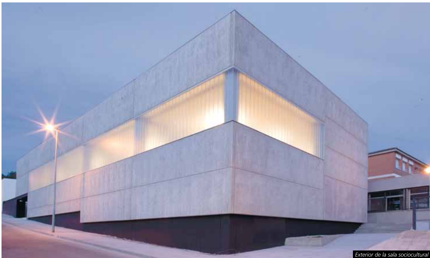
Exterior de la sala sociocultural