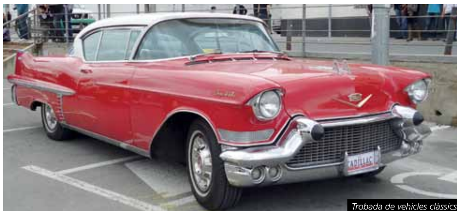
Trobada de vehicles clàssics

Molts dels participants eren de Cubelles i de Vilanova i la Geltrú però molts d'altres van arribar de municipis de les comarques de l'Alt Penedès,