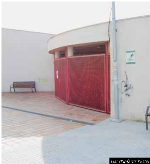
Llar d'infants l'Estel

Tota la informació està disponible al web www.cubelles.cat