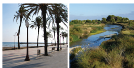
5 Promenade maritime