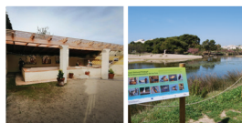
5 Lavoirs municipaux