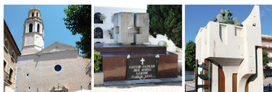
4 Église de Sainte Marie de Cubelles