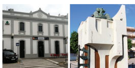
3 Gare de Cubelles