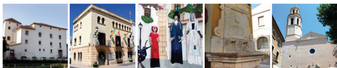
1 Château de Cubelles