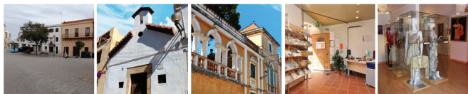
6 Plaça de la Font