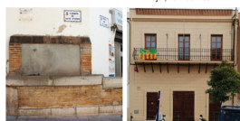
3 Fontaine de la rue Sant Antoni, fontaine avec abreuvoir