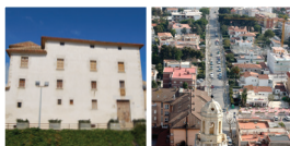
1 Château de Cubelles