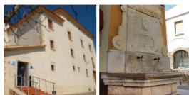
1 Château de Cubelles