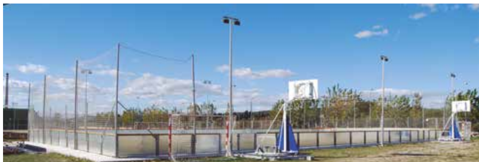
Les obres es van inaugurar a començaments de maig.

Aquesta inversió estava supeditada a la venda d'un terreny municipal, que es va executar a finals del passat exercici. Ara, els serveis tècnics municipals han redactat el projecte que s'executarà en dues fases. En la primera, es cobrirà la totalitat de la pista poliesportiva, s'instal·larà l'enllumenat sobre l'estructura i es dotarà del material esportiu necessari. En la segona, s'afegirà