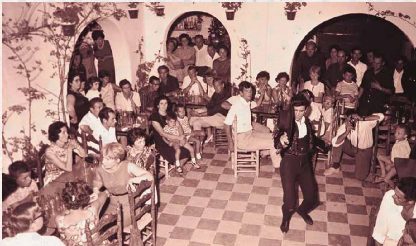
Patio andaluz, dècada de 1960

Durant la dècada dels 60 del segle passat, a Cubelles van proliferar diversos locals d'oci de nova fornada. Un dels més característics i recordats seria El Patio Andaluz, inaugurat el 1963 i ubicat al capdavall del carrer de Víctor Balaguer, a tocar de la peixateria de la família Amat Fontanals, que n'eren els propietaris. La sala tenia una pista de ball a l'aire lliure i, com no podia ser d'una altra manera, s'hi oferien sessions de tablaó flamenc.