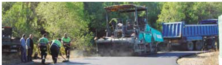
Les feines abraçaran barris d'arreu de la vila.

Així, es preveu que la durada màxima d'execució de cada una de les fases sigui de quinze dies, sumant un total d'un mes i mig entre les tres. Els treballs es distribuïran, principalment, pels barris de La Gaviota, Residencial Les Salines, Marítim, Sud Sumella i Eixample, entre més.