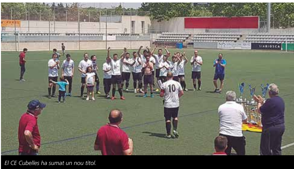
El CE Cubelles ha sumat un nou títol.

Sort desigual en els equips sènior de futbol, bàsquet, vòlei hoquei patins