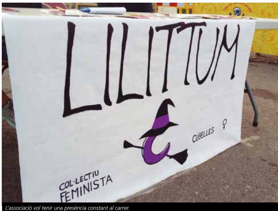
L'associació vol tenir una presència constant al carrer.

Correu electrònic: lilittumassembleafeminista@gmail.com.