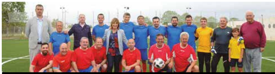
El nou equipament acollirà també activitats socials.

problemes "de les primeres hores d'entrenaments, perquè el camp de futbol està saturat", alhora que confia que també a darrera hora "la gent que acabi de treballar i vulgui fer esport per gaudir, el pugui llogar".