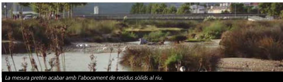
La mesura pretén acabar amb l'abocament de residus sòlids al riu.

que arriben fins a la desembocadura i podria millorar les condicions ambientals i la biodiversitat actual de l'aigua.