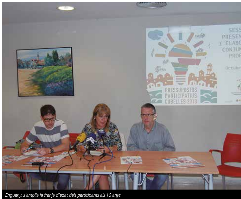
Enguany, s'amplia la franja d'edat dels participants als 16 anys.

Es podran fer propostes de tot tipus, fins i tot relacionades amb el nomenclàtor.