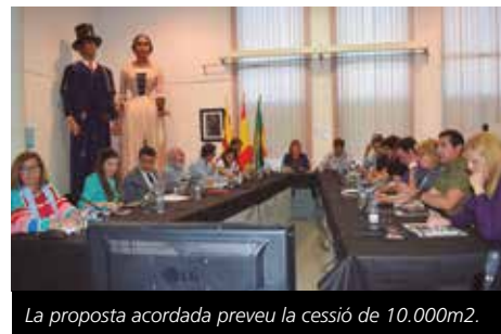
La proposta acordada preveu la cessió de 10.000m2.

El ple de l'Ajuntament també va aprovar amb les úniques abstencions de Guanyem i Cubellencs-FIC el reglament de funcionament i organització del consell de la ciutadania, ÈPOCA. El punt va tirar endavant després que s'informés de l'acceptació de dues al·legacions presentades per Guanyem Cubelles, la primera relativa a