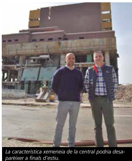
La característica xemeneia de la central podria desaparèixer a finals d'estiu.

tructura. Personalment, crec que la conservació de l'espigó pot ser beneficiós tant per a nosaltres, com per als dos municipis.